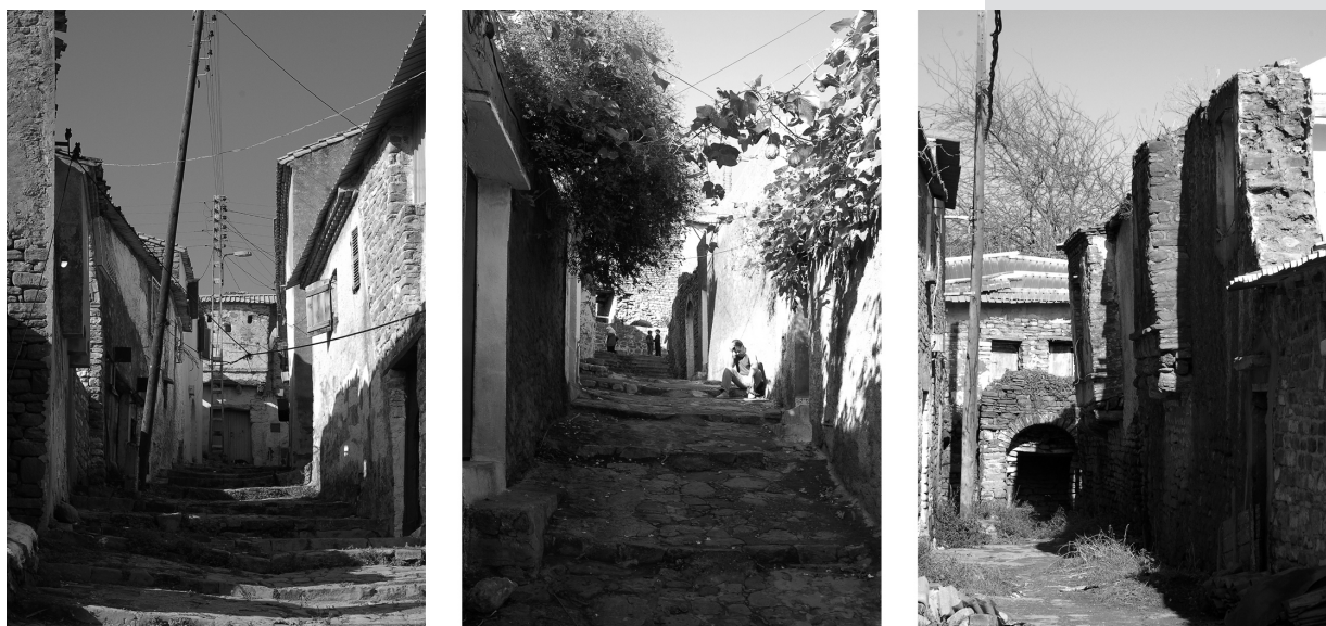
Figure 1. Urban scenes of the ancient casbah.

The mesh is hierarchical and stretches where the fabric is denser. Some alleys branch off from the main and secondary paths, allowing the penetration to the denser and more compact fabric; the alleys give access to the innermost areas, which do not face main roads and which structure the proprietary parcelling of the larger blocks.