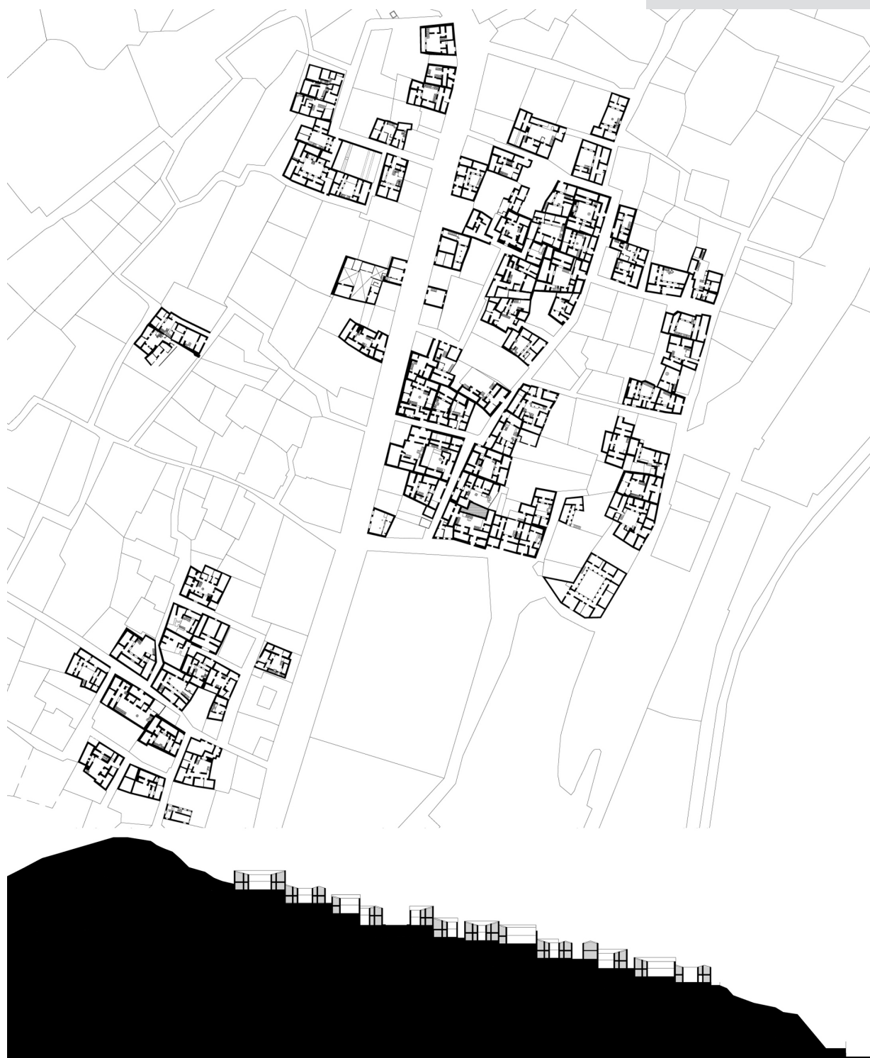
Figure 2. Plan with walls and urban section of the ancient casbah.

elemento di grande forza e chiarezza urbana. I percorsi, mai rettilinei, sono connotati dalla presenza di continui punti d'arresto, interruzioni, piccoli slarghi, cambi repentini di direzione. Lungo i percorsi di discesa verso la costa e il porto, sia nella parte alta che in quella bassa della casbah, si aprono continui e sempre differenti scorci sul mare. Per quanto concerne la città coloniale, già dal 1845, appena un anno dopo l'occupazione di Dellys da parte dei francesi, il documento