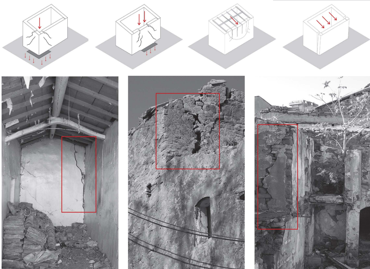
Figure 4. Recurring forms of degradation of masonries.

Questioni di ordine culturale da un lato e tecnologico-strutturali dall'altro, dunque, suggeriscono molta attenzione nell'impiego di materiali di nuova concezione per il risarcimento dell'architettura tradizionale e soprattutto impongono un approfondimento in termini di conoscenza del costruito storico e sulla compatibilità con le necessarie innovazioni costruttive.