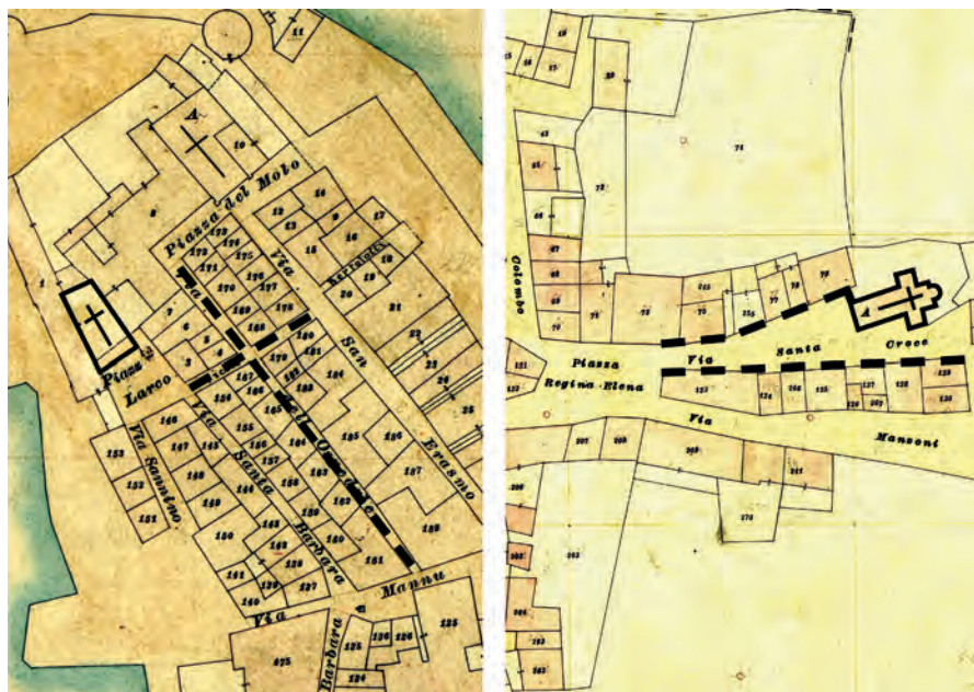
Fig. 4: Schema progettuale della ristrutturazione urbanistica della jubaria di Alghero “in modo crucis” proposto alla fine del Cinquecento in relazione alla chiesa di Santa Croce (a sinistra), similmente ai casi di Cagliari, Bosa e Orani; impianto di nuove lottizzazioni coordinato con la chiesa di Santa Croce e la piazza triangolare antistante, Ittireddu (a destra) (base cartografica Cessato Catasto, Archivio di Stato di Cagliari; rielaborazione da CADINU 2009)