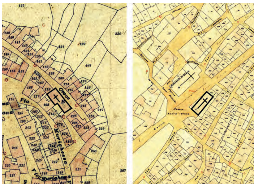
Fig. 5: Schema progettuale della chiesa di Santa Croce lungo nuova lottizzazione, Mara (a sinistra); modello di insediamento della chiesa di Santa Croce parallelo alla chiesa parrocchiale, addossata o separata da questa da una strada-piazza come a Silanus (a destra) (base cartografica Cessato Catasto, Archivio di Stato di Cagliari)