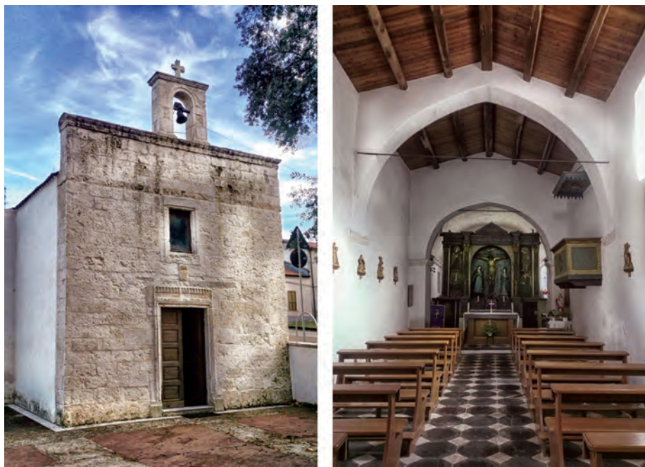
Fig. 2: Chiesa di Santa Croce, Cargeghe (esterno e interno). L'edificio reca all'interno la data 1630. Si conserva bolla di riconoscimento della confraternita locale a firma del cardinale Barberini datata 1646