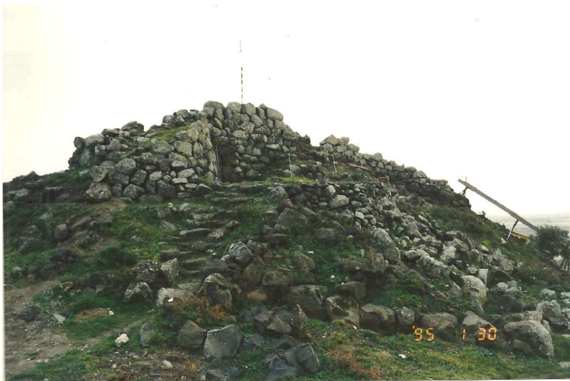
Fig. 3. MOGORO - Loc. Cuccurada. Il nuraghe ripreso da Nord alla fine delle operazioni del I cantiere di scavo (1995).