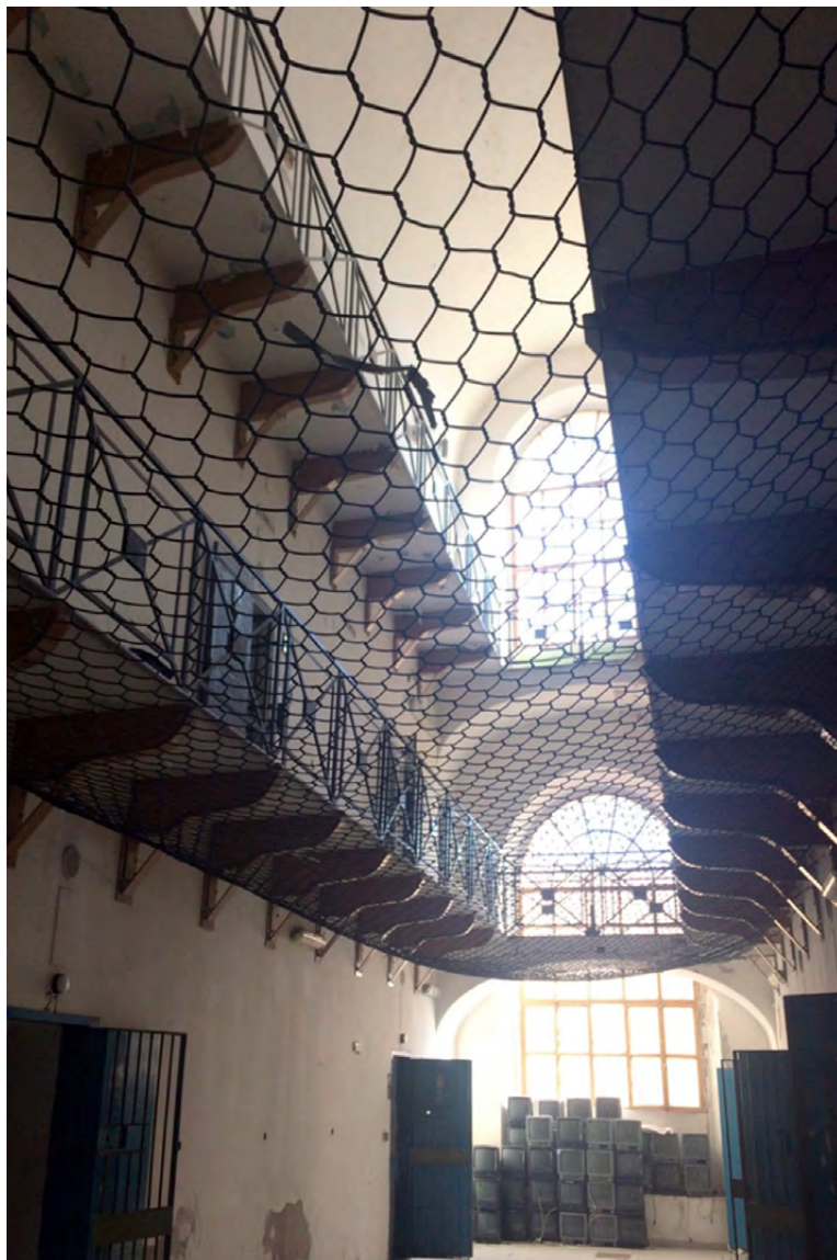
Figura 10. Un braccio interno del Carcere dopo la dismissione.