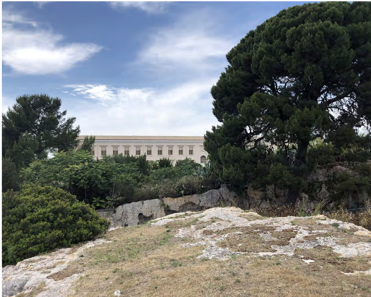
Figura 9. Lato sud del carcere, parlatorio più esterno.