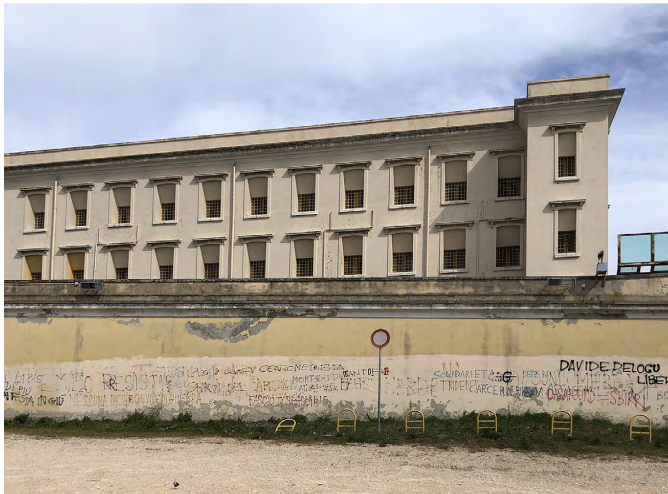
Figura 1. Cagliari. Lato nord del Carcere di Buoncammino.