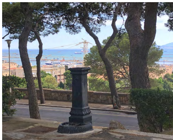
Dall'alto, in ordine orario, figura 5. Panchine senza verso e disassate; figura 6. Un chiosco lungo viale Buoncammino; figura 7. Fontana non funzionante; figura 8. Chiosco in disuso.