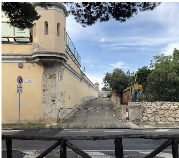
Dall'alto, in ordine orario, figura 2. Portone di ingresso del Carcere; figura 3. Traguardo lungo. La città e il mare visti dal viale Buoncammino; figura 4. Garitta lato sud, varco ingresso mezzi.