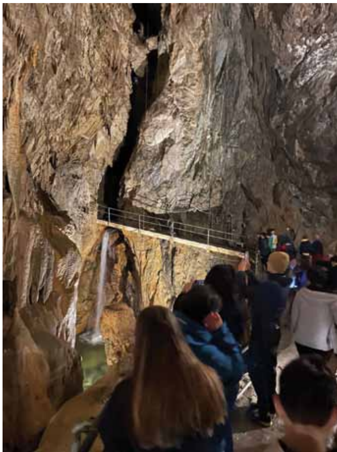
Fig. 7 - . Classe 1ª della Scuola Secondaria di primo grado Rol (S. Secondo di Pinerolo, TO) durante la gita scolastica presso le Grotte di Bossea (CN), organizzata come premio per i vincitori della Categoria Scuole al Photo Contest “ACQUE SOTTERRANEE – RENDERE VISIBILE L’INVISIBILE: L’ESPERIENZA ITALIANA”.

Fig. 6 - 1st prize winning photograph in the Schools Members' Category of the Photo contest, entitled “Pozzo di San Patrizio (Orvieto)”.