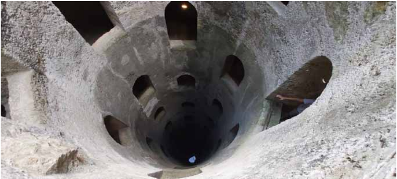
Fig. 6 - Fotografia vincitrice del 1° premio Categoria Scuole, dal titolo “Pozzo di San Patrizio (Orvieto)” (fotografia classe 1A, Scuola secondaria di primo grado Rol, S. Secondo di Pinerolo, TO).

Infine il 1° premio Categoria Scuole è andato alla classe 1ª della Scuola secondaria di primo grado Rol (S. Secondo di Pinerolo, TO) con la fotografia “Pozzo di San Patrizio (Orvieto)” (Fig. 6); il premio è consistito nell’organizzazione di una gita scolastica giornaliera per l’intera classe presso le Grotte di Bossea (CN), tenutasi il 27 ottobre (Fig. 7). Uno slideshow con le migliori fotografie inviate è stato prodotto da Stefania Da Pelo e caricato nella homepage del sito IAH Italy ( https://www.iahitaly.it/ ) e su Youtube ( https://www.youtube.com/watch?v=JxmSw9ByKpY ). Tra le attività di divulgazione e promozione