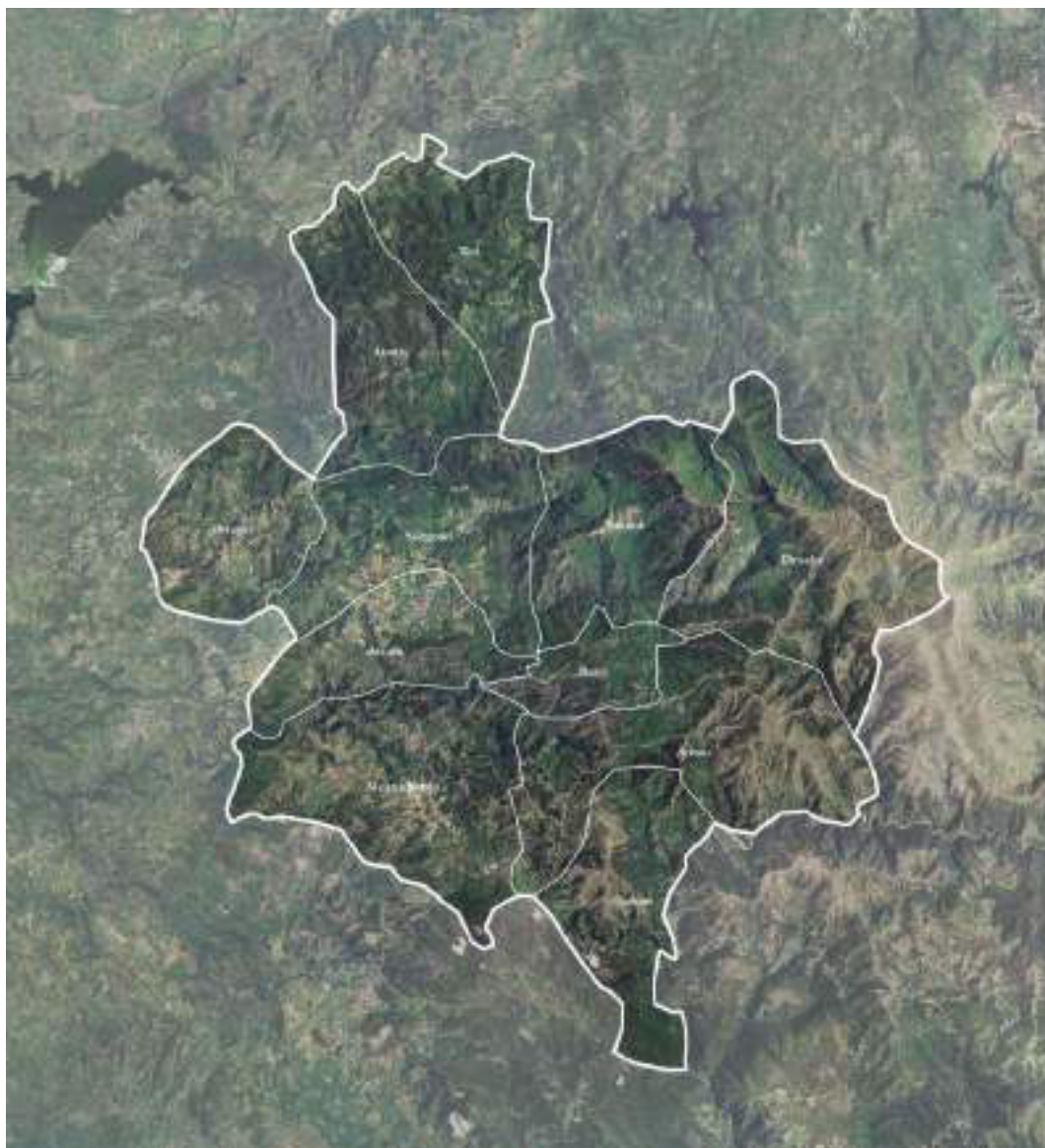
Figura 1 | L'area interna del Gennargentu-Mandrolisai in Sardegna.

Tale ricchezza coesiste, tuttavia, con notevoli criticità socio-demografiche e infrastrutturali. L'area, la cui popolazione complessiva ammonta a circa 13.200 unità (ISTAT, 2019) è infatti interessata da un costante spopolamento e dal progressivo invecchiamento demografico. Questa tendenza è evidenziata dal fatto che quattro degli undici comuni registrano una popolazione residente inferiore ai 1.000 abitanti e da una densità abitativa particolarmente bassa (23 ab./km 2 ), nettamente al di sotto della media regionale (68 ab./km 2 ). La condizione di marginalità territoriale è ulteriormente certificata dalla classificazione adottata dalla SNAI, che include dieci comuni nella categoria "ultraperiferica" e uno in quella "periferica". Proprio in virtù di queste criticità, l'area è stata selezionata come area pilota sia nel ciclo di programmazione 2014-2020 che in quello 2021-2027, configurandosi come caso studio emblematico per l'analisi dei processi di marginalizzazione delle aree interne nel territorio sardo.