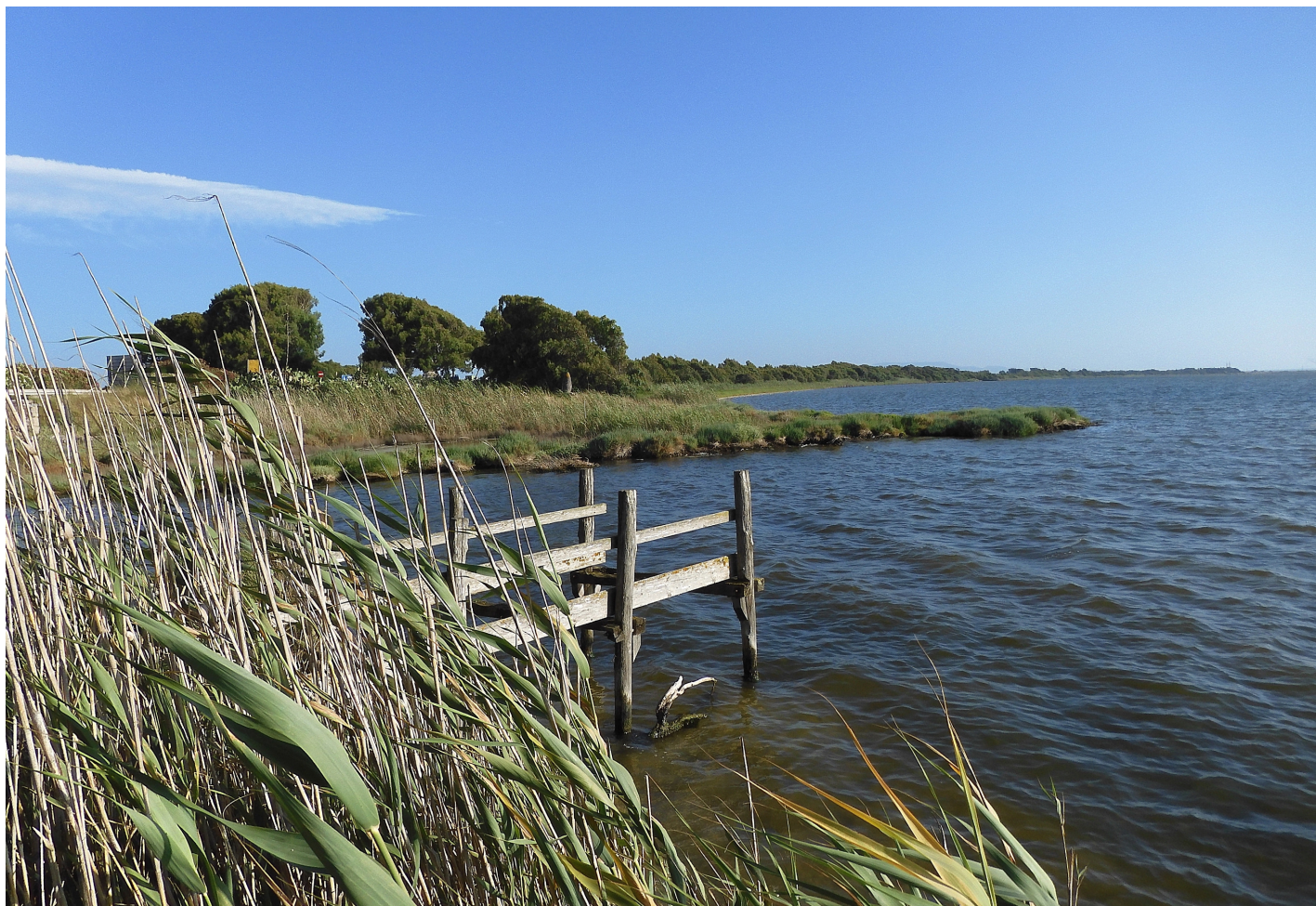
Foto 3 - Sopra: sponda orientale dello Stagno di Santa Giusta, in direzione Sud