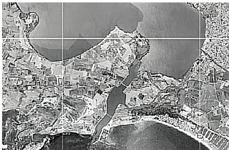
Figura 2 - Configurazione attuale della parte meridionale dello Stagno di Cabras