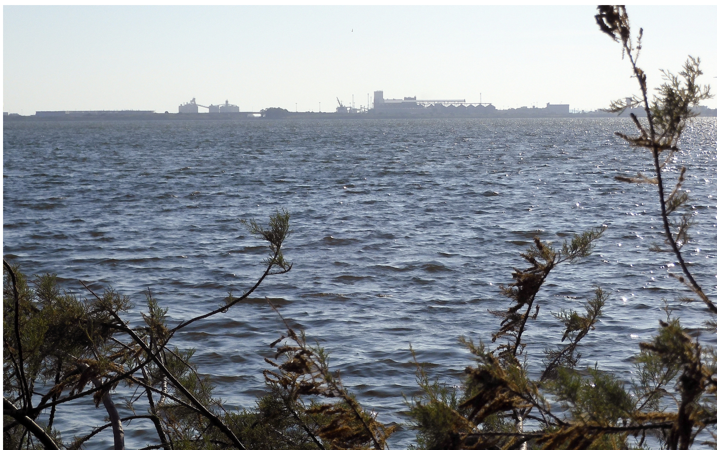
Foto 4 - Sotto: lo Stagno di Santa Giusta dalla sponda orientale. Sullo sfondo: Oristano, zona industriale