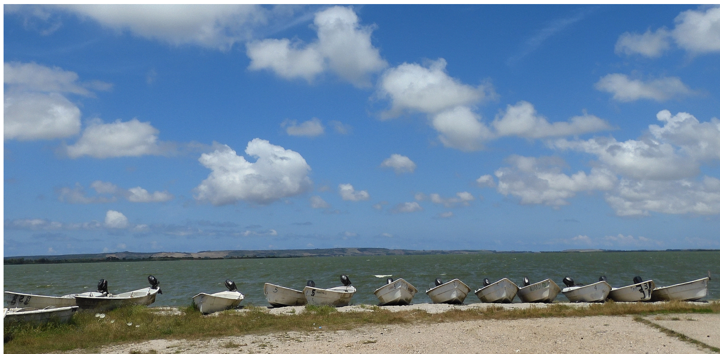
Foto 1 - Sopra: lo stagno di Cabras dalla località Su Scaiu