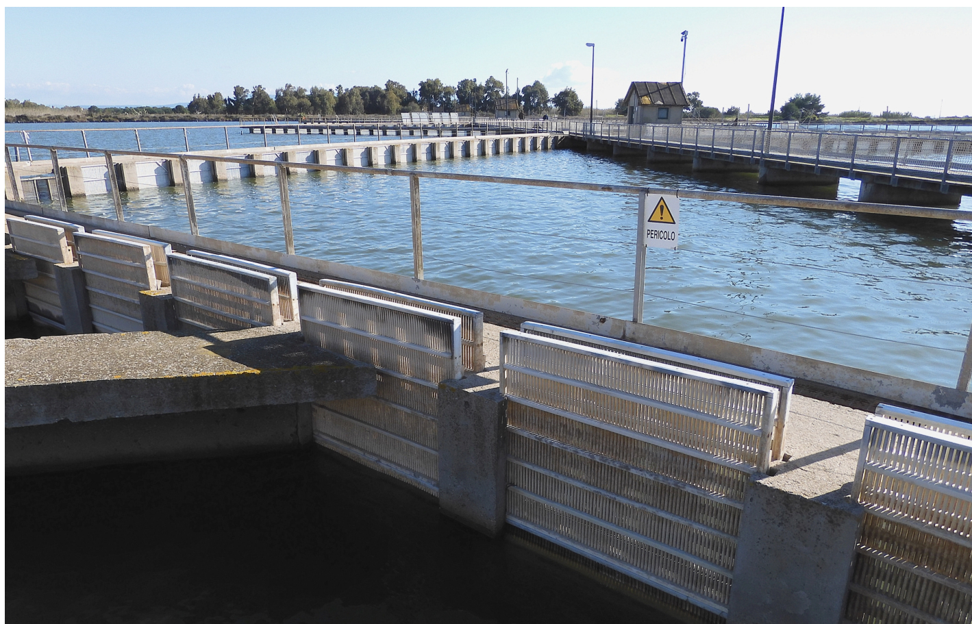
Foto 2 - Sotto: Peschiera in località Sa Mardini