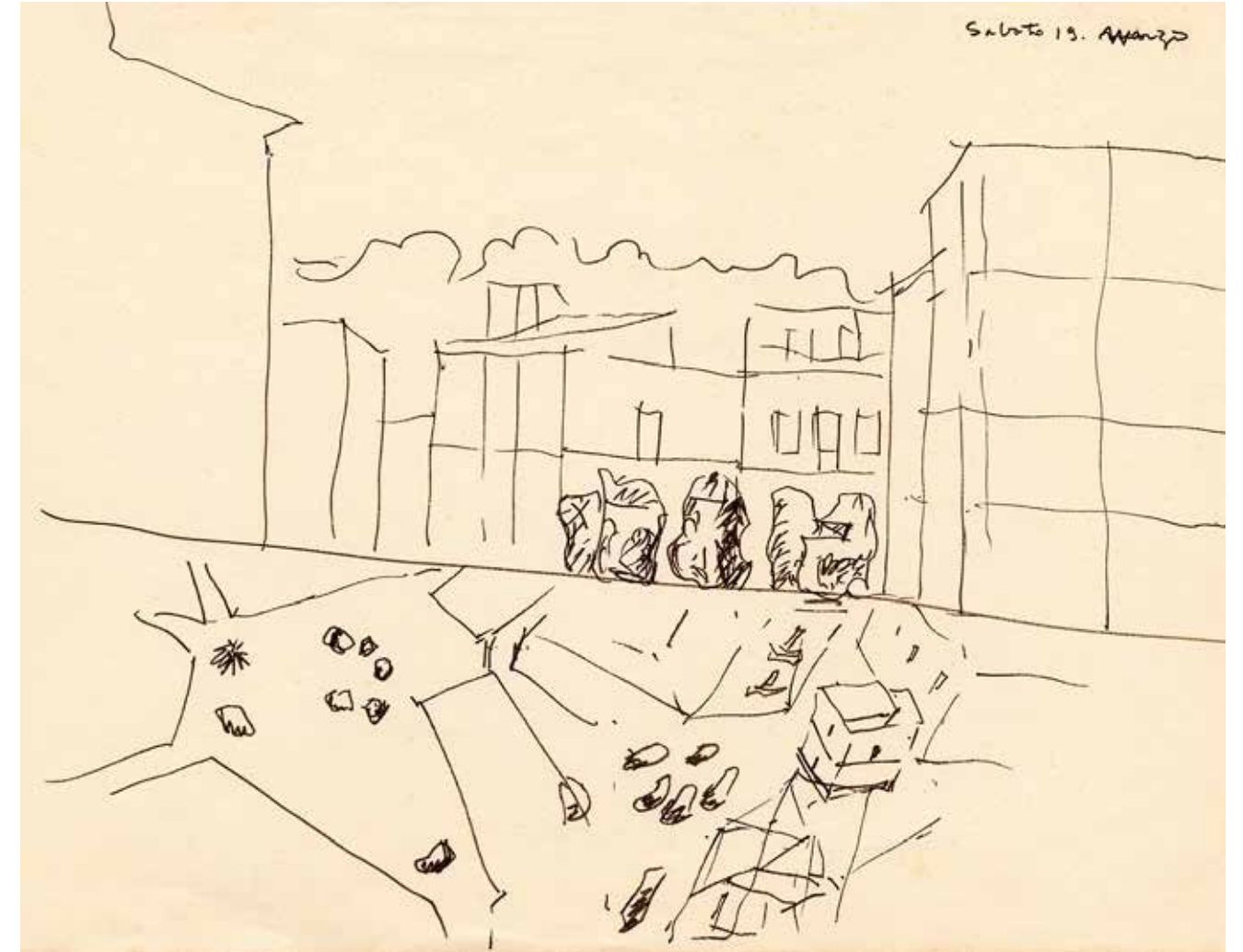
Satta di Nuoro, nel "Il piano d'uso collettivo a Gramsci" di Ales, nella Plaza de los Fueros a Vitoria, discusse in altrettanti articoli in questo numero di Aristana.

Le opere di Nivola e Fancello negli esterni del palazzo della Regione Sardegna di Cagliari costituiscono un chiaro esempio di tale pratica, in cui si assiste al contrasto estremo tra un'architettura goffa e al limite violenta e la serie di raffinatissime sculture che avrebbero dovuto ricondurla alla dimensione umana. Svincolandosi da rapporti così asimmetrici l'arte, in qualche misura delusa dall'architettura, si è appropriata da decenni di un ampio numero di supporti, concreti o virtuali, effimeri o illegali, attraverso cui emettere nuovi segnali. Nelle piazze essa talvolta ha fatto da sé, senza ricorrere a particolari legami con l'architettura, come si vede nella Stephen Wise Plaza di New York City, nella Piazza