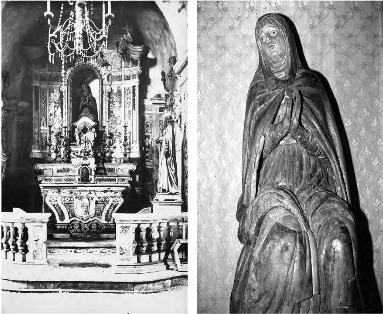
Fig. 5: La cappella Dugoni, del 1800, con la statua della Madonna dei Sette Dolori, scolpita da Scipione Aprile su commissione della “ archiconfraternitat y compaña del la Sanch de Jesu Crist, ditta dels Vermills, de la present ciutat de Caller ” testimoniata dal contratto del 1600 (ASPSE). La statua lignea, che emula la posa orante della Madonna dei Sette Dolori dipinta dal Cavaro in quel tempo posta nel convento del Jesus, è stata riscoperta nel 2010 grazie ai nostri confronti tra documenti e foto e oggi è conservata presso l’Arcivescovado di Cagliari.