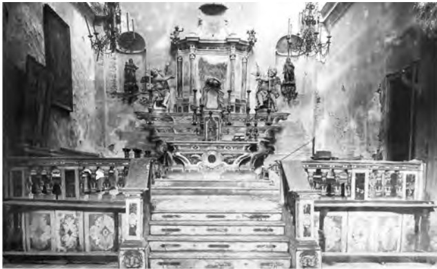
Fig. 3: La navata della chiesa e il particolare dell'altare maggiore ripresi nei giorni precedenti la demolizione (ASPSE)