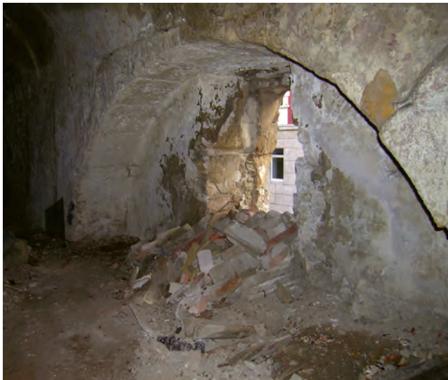
Fig. 4: Una delle arcate sulle finestrelle della galleria aperte sull'aula sottostante