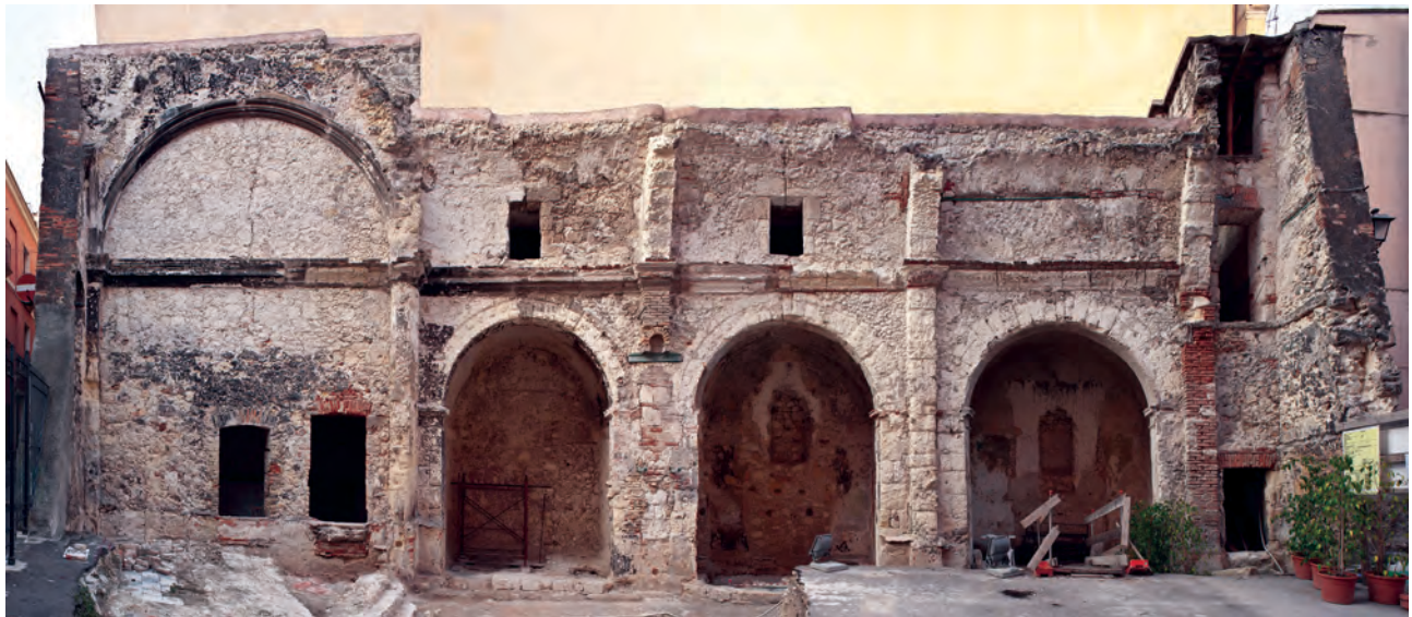
Fig. 2: Veduta del residuo prospetto delle cappelle di destra durante i lavori di smuramento e recupero del rudere diretti dallo scrivente tra il 2011 e il 2014