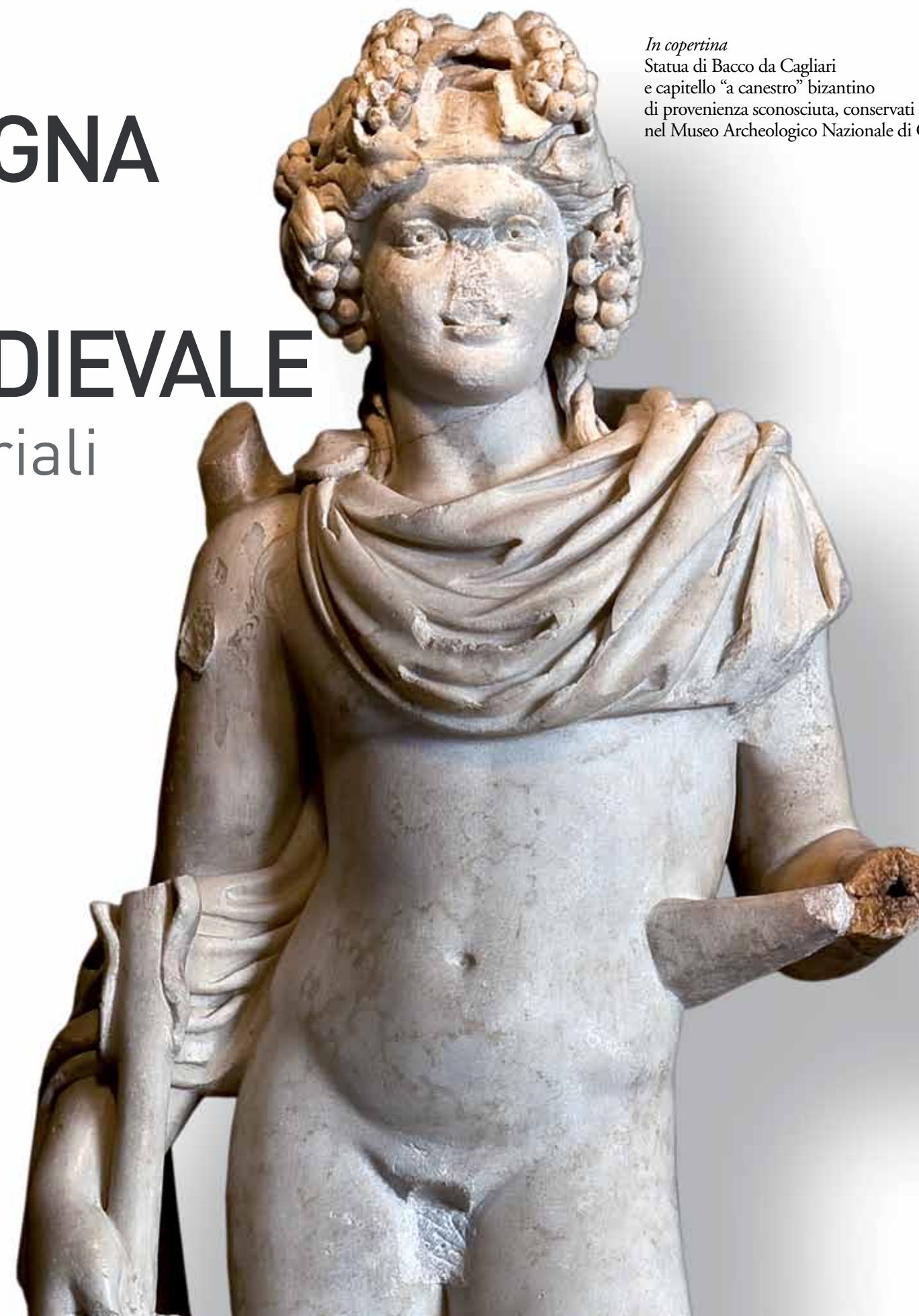
In copertina Statua di Bacco da Cagliari e capitello "a canestro" bizantino di provenienza sconosciuta, conservati nel Museo Archeologico Nazionale di Cagliari