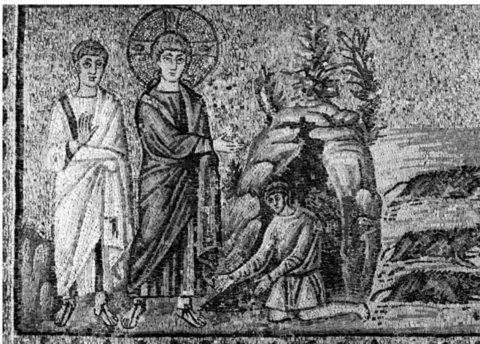
Fig. 8. Ravenna, Basilica di Sant'Apollinare Nuovo. Mosaico raffigurante la guarigione dell'ossesso di Gerasa, ubicato nel registro superiore della navata centrale (da http://www.fondazioneravennacapitale.it/teodorico/.).