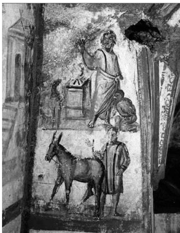
Fig. 4. Roma, Ipogeo di via Dino Compagni, lato destro della nicchia di sinistra del cubicolo C. In alto, il sacrificio di Isacco; in basso, il servo attende con l'asino ai piedi della montagna (da FERRUA 1960, tav. XCIX).