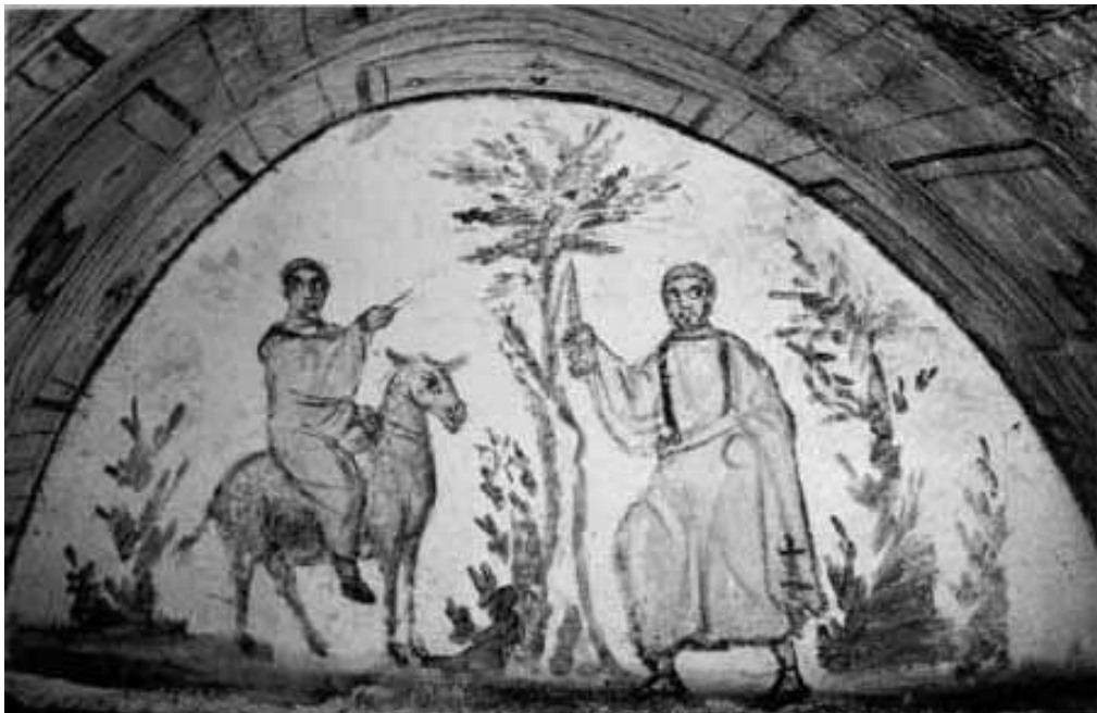
Fig. 6. Roma, Ipogeo di via Dino Compagni, lunetta di fondo dell'arcosolio destro del cubicolo. F. Balaam, a cavallo della sua asina, viene fermato dall'angelo (da FERRUA 1960, tav. CIV).