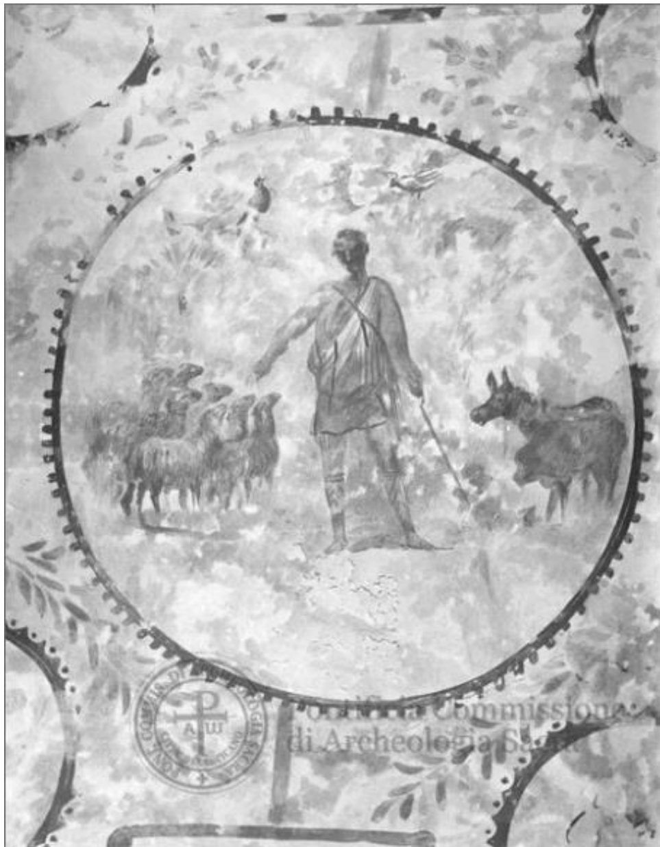
Fig. 9. Roma, Catacomba di Pretestato, regione della Spelunca Magna, cubicolo del Pastore che difende il gregge. Il Buon Pastore separa le pecore dagli animali impuri (da http://www.archeologiasacra.net/pcasweb/scheda/fotografico/PCASST0211298/Catacomba-di-Pretestato/Cubicolo-cosiddetto-del-pastore-che-difende-il-gregge-da-acquarello?page=1&query=storico_Catacomba-di-Pretestato&filter=catacomba&text=&jsonVal={%22filtersSoggettiArtistici%22:[%22Pastore%22]} ). © P. C. A. S.).