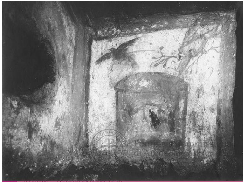
Fig. 1. Roma, Cimitero di Panfilo. Affresco ubicato nel sottarco del cd. "Arcosolio dell'Agnello nimbato" raffigurante l'arca di Noè con la colomba e il corvo (da http://www.archeologiasacra.net/pcasweb/scheda/fotografico/PCASST0207894/Catacomba-di-Panfilo/Volta-larca-di-No%C3%A8?page=1&query=storico_Catacomba-di-Panfilo&filter=catacomba&text=&jsonVal={%22filtersSoggettiArtistici%22:[%22Colomba/e%22]} ). © P. C. A. S.).