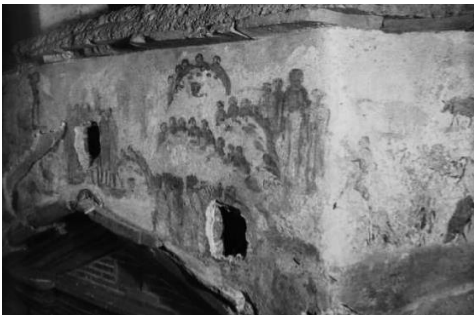
Fig. 7. Roma, Sepolcreto cosiddetto 'della piazzola', Attico del mausoleo di Clodius Hermes. Guarigione dell'ossesso di Gerasa sul lato destro (da BISCONTI 2011.).