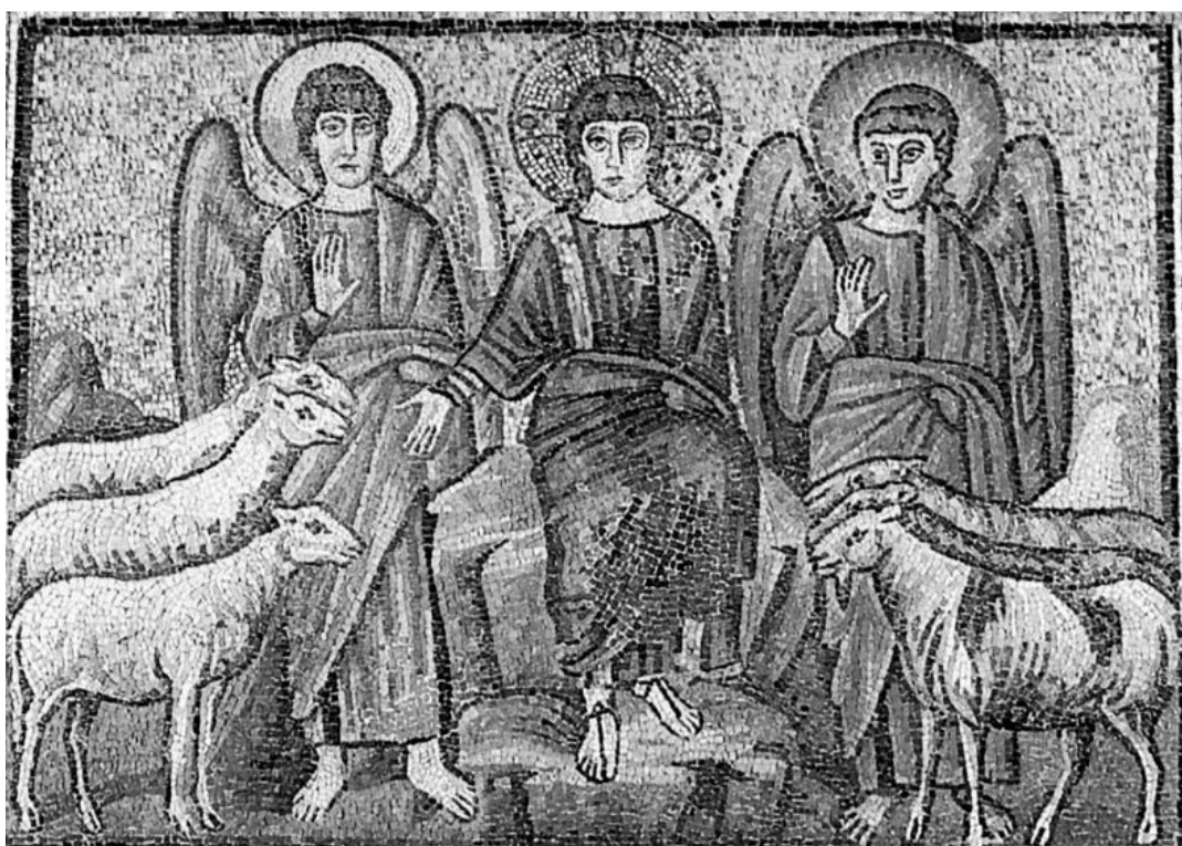
Fig. 11. Ravenna, Basilica di Sant' Apollinare Nuovo. Mosaico raffigurante Cristo tra due angeli che separa le pecore dai capri, ubicato nel registro superiore della navata centrale.