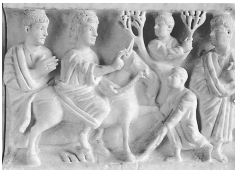
Fig. 3. Siracusa, sarcofago di Adelfia. Particolare del registro inferiore: Cristo entra a Gerusalemme sul dorso di un'asina (da SGARLATA 1998).