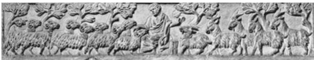
Fig. 10. New York, Metropolitan Museum. 'Coperchio Stroganoff', pastore che separa le pecore dai capri (da PIVA 2013).