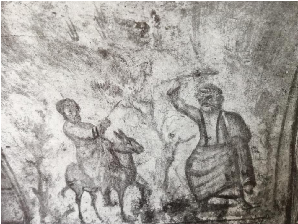
Fig. 5. Roma, Ipogeo di via Dino Compagni, parte sinistra della volta dell'arcosolio destro del cubicolo. B. Balaam, a cavallo della sua asina, viene fermato dall'angelo (da FERRUA 1960, tav. XXVI).