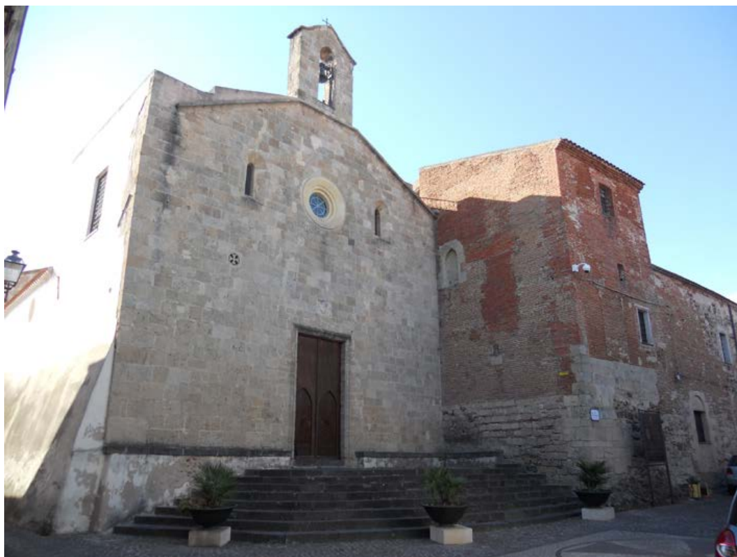
Fig. 3. Oristano, chiesa e monastero di Santa Chiara.