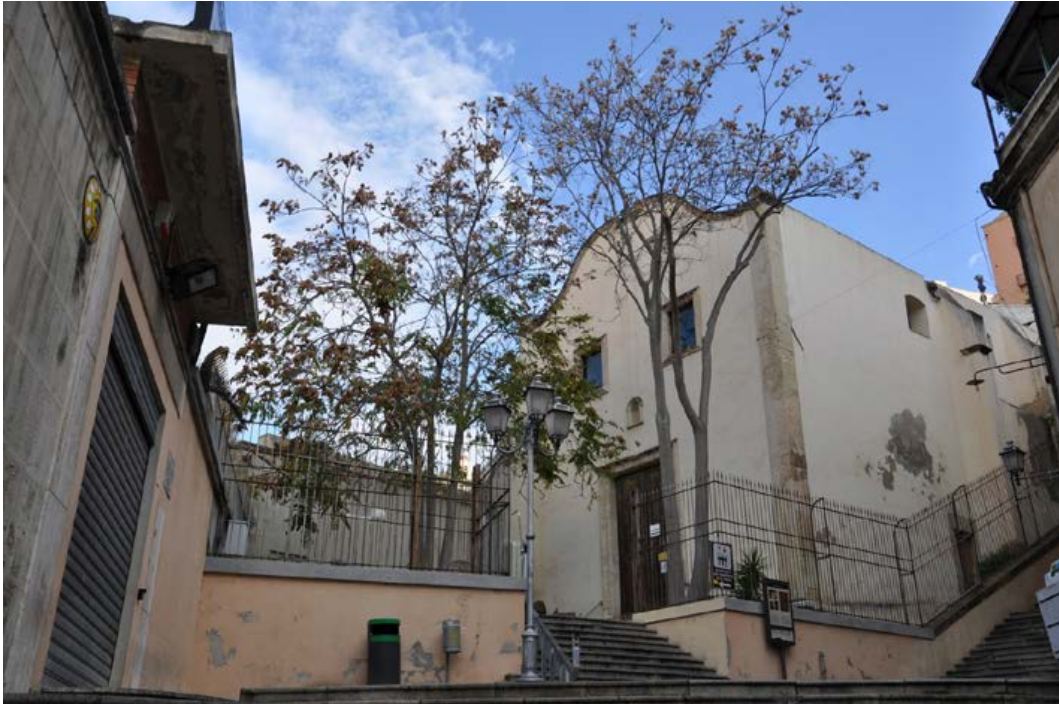
Fig. 1. Cagliari, chiesa di Santa Chiara (sec. XVII).

soppressione degli ordini religiosi. La chiesa di Santa Chiara, ricostruita nel XVII secolo e ristrutturata negli anni Novanta del Novecento, è attualmente l'unico vestigio dell'antico complesso clariano 50 (si veda fig. 1); dei monasteri di Santa Lucia e della Concezione rimangono le chiese, ricostruite tra la fine del XVI e i primi decenni del XVII secolo, e gli edifici monastici che, ristrutturati, sono stati adibiti nel tempo ad usi diversi.