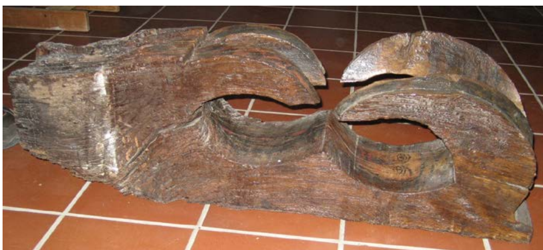
Fig. 6. Oristano, chiesa di Santa Chiara, mensola lignea a foglie ricurve.

secolo del sud Sardegna. Tra i due esemplari, uno risulta mutilo delle quattro foglie aguzze. Nella concavità interna si leggono in entrambi delle decorazioni con due volti, che raffigurano rispettivamente un personaggio con la corona e una figura femminile, meno distinguibile della prima immagine contenuta nella mensola più integra. L'ultima mensola superstite riproduce la figura di un uomo con cappello, in posizione prona. Anche in questo caso si notano delle evidenti tracce di cromia ma, diversamente dalle altre, certamente riconducibili a un momento di molto successivo alla realizzazione dei manufatti: si distinguono due stemmi per lato raffiguranti bande gialle e rosse, assimilabili ai pali d'Aragona. È ipotizzabile che anch'essa facesse parte di una coppia di mensole, analogamente alle precedenti.