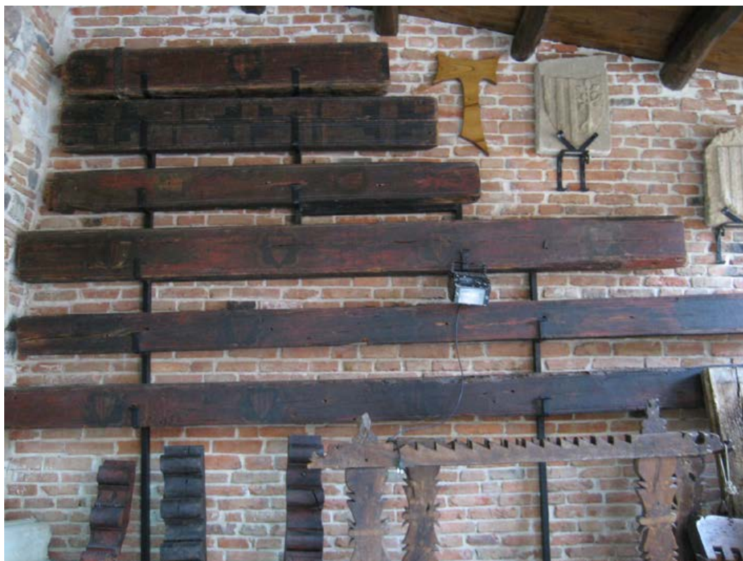
Fig. 7. Oristano, monastero di Santa Chiara, travi lignee.