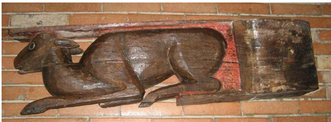
Fig. 5. Oristano, chiesa di Santa Chiara, mensola lignea con cerbiatto.