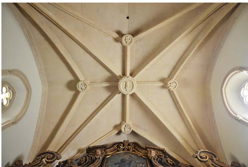
Fig. 9. Cagliari, chiesa della Purissima Concezione, volta stellare del presbiterio.