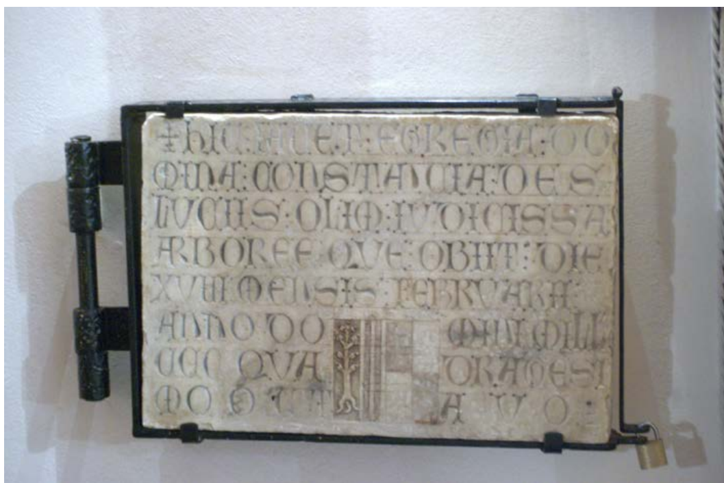
Fig. 4. Epigrafe di Costanza di Saluzzo nella chiesa di Santa Chiara a Oristano.