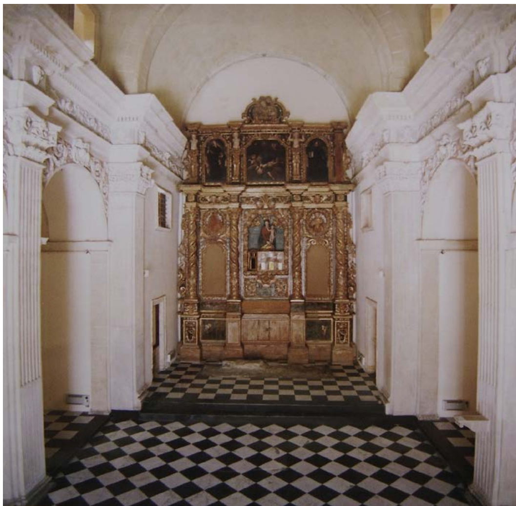
Fig. 10. Cagliari, chiesa di Santa Chiara, interno.

Nelle altre realtà urbane della Sardegna la vicenda dei conventi clariani è incerta; per quanto riguarda l'epoca moderna, le esigue fonti disponibili mantengono il riserbo sull'estetica dei monumenti e sul patrimonio di opere d'arte un tempo custodite all'interno di questi complessi. Il monastero oristanese di Santa Chiara raggiunge il massimo splendore architettonico nel cuore del Medioevo, riservando ai secoli seguenti sporadici interventi di restauro. Trasferendoci nella dinamica realtà di Sassari, il quadro delle residenze femminili annovera i due grandi conventi di Santa Elisabetta, poi intitolato a santa Isabella, e di Santa Chiara 107 .