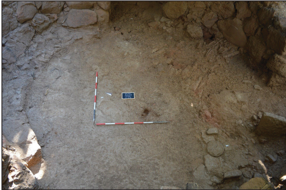
Fig. 2 - Bruncu e' s'Omu, Villa Verde (OR): la capanna 17 durante le operazioni di scavo.

Bruncu e' s'Omu, Villa Verde (OR): hut n. 17 during the dig.