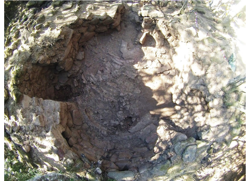
Fig. 3 - Bruncu e' s'Omu, Villa Verde (OR): fine delle operazioni di scavo nella capanna 17. Particolare delle corde laviche e della roccia basale.

Durante la V campagna (2017) si sono ripresi i lavori con l'asportazione della US 310 (fig. 2). Presso il nicchione Est, dopo lo scavo della US 310, si è messo in luce uno strato di pietrame di piccole dimensioni (US 320), realizzato ai fini del riempimento delle asperità del bancone roccioso basale