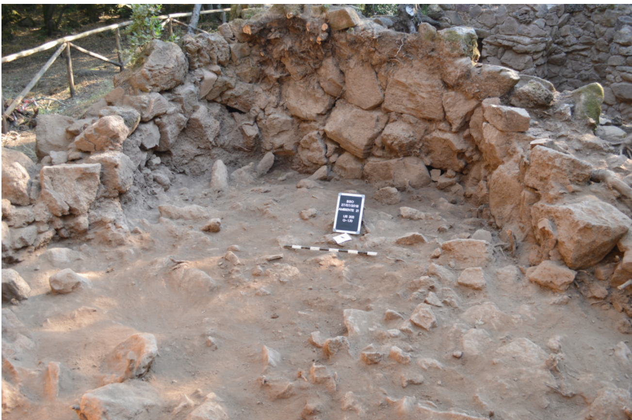
VILLA VERDE, loc. Bruncu e' S'Omù - Vano 21: fine delle operazioni di scavo, particolare dell'area NW della capanna