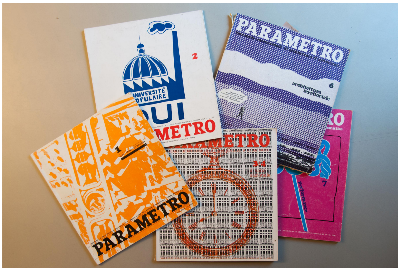
Fig. 4 Alcuni numeri di Parametro .

E se vi è una 'etica' nel fare architettura, nel proporre cioè progetti per ipotetiche realizzazioni, essa sembra consistere nel produrre l'insieme di sistemi, forme, strutture, organismi e realizzazioni organiche tra gli elementi perché il progetto, cioè l'immaginazione della creatività, trovi possibilità di crescere costruttivamente secondo una logica naturale. E secondo il principio del 'più nel meno' che attiene non solo alla 'fatica' dei materiali e delle strutture, ma anche a quella, più penosa, della categoria umana che tale 'cosa' deve pagare e mantenere nel tempo. Non sembra vi sia etica nel proporre una costruzione che esteticamente soddisfa come ex tempore di scuola d'arte, ma che chiama in causa processi di statica così complessi che,