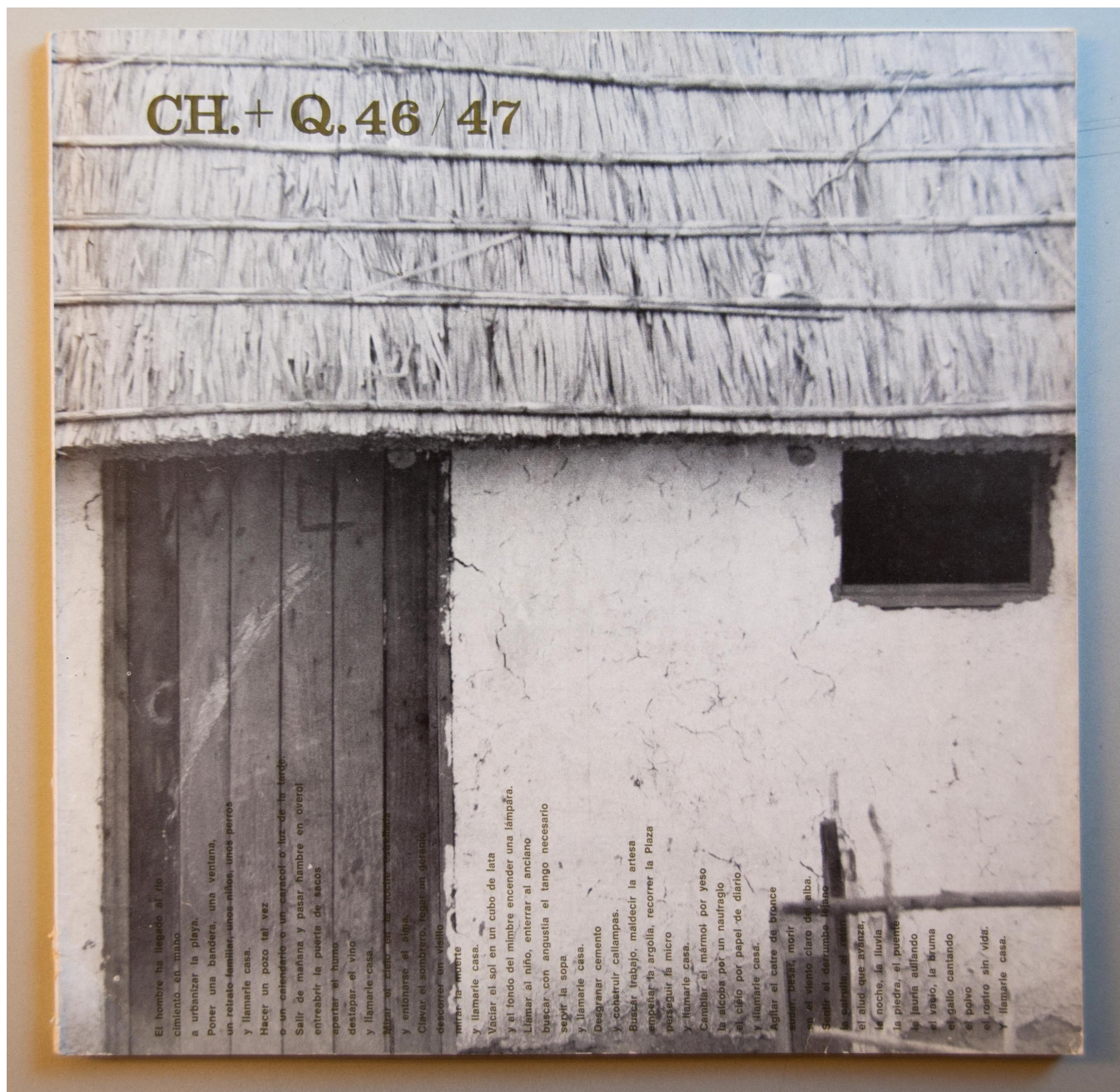
Fig. 2 L'ultimo numero di Chiesa e Quartiere .

la insegna a falsificare, a rendere prima di avere, a mostrare prima di possedere, al curare immagini senza insegnare la dottrina professionale per giungere al controllo della materia architettonica. Non una pianta relazione ad un prospetto. Non una sezione che permetta di leggere gli spazi. Non uno schema che indichi come sia pensata la struttura! 6