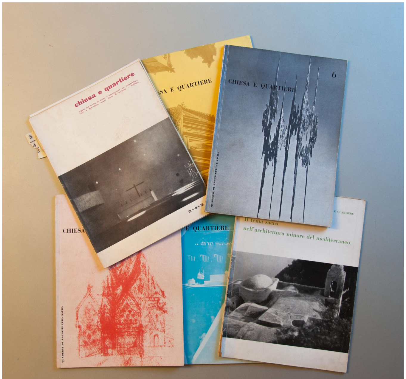
Fig. 1 Alcuni numeri di Chiesa e Quartiere .

Abbiamo già pianto e ci siamo strappati i capelli altre volte sulla mancata disciplinarietà della scuola italiana che non è in grado di preparare operatori tecnici capaci di controllare il progetto e l'esecuzione nei suoi parametri costruttivi, ma ora la caduta è più profonda. Passata la fase alienante del post-moderno che ha allontanato una intera classe professionale dal progetto buttandola allo sbaraglio sul balbettio da operetta della sagoma esterna, ora la scuo-