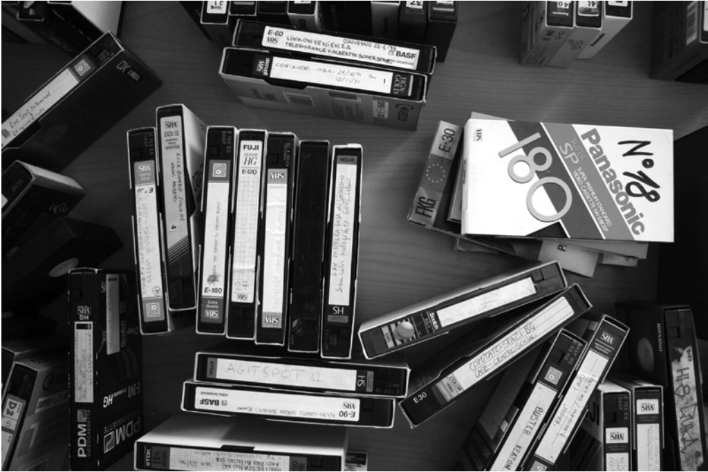
Occorrenze del fondo Pveh.

universitarie. Per raggiungere un simile obiettivo, i videogiornalisti crearono un piccolo network utilizzando i videoregistratori presenti nelle aule 2 .