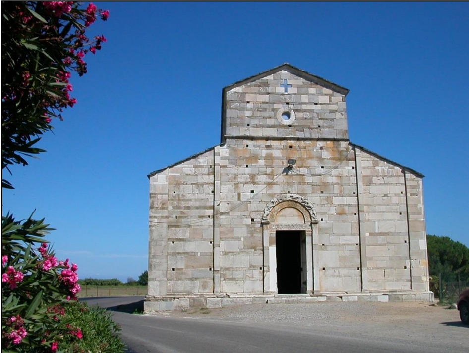
Fig. 2 - Mariana (Lucciana, Haute Corse), Santa Maria Assunta, facciata.