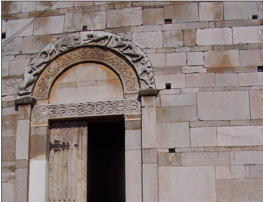
Fig. 5 - Mariana (Lucciana, Haute Corse ), Santa Maria Assunta, decorazione scultorea in facciata.

Nicoletta Usai, Santa Maria Assunta di Mariana (Lucciana, Haute-Corse) .