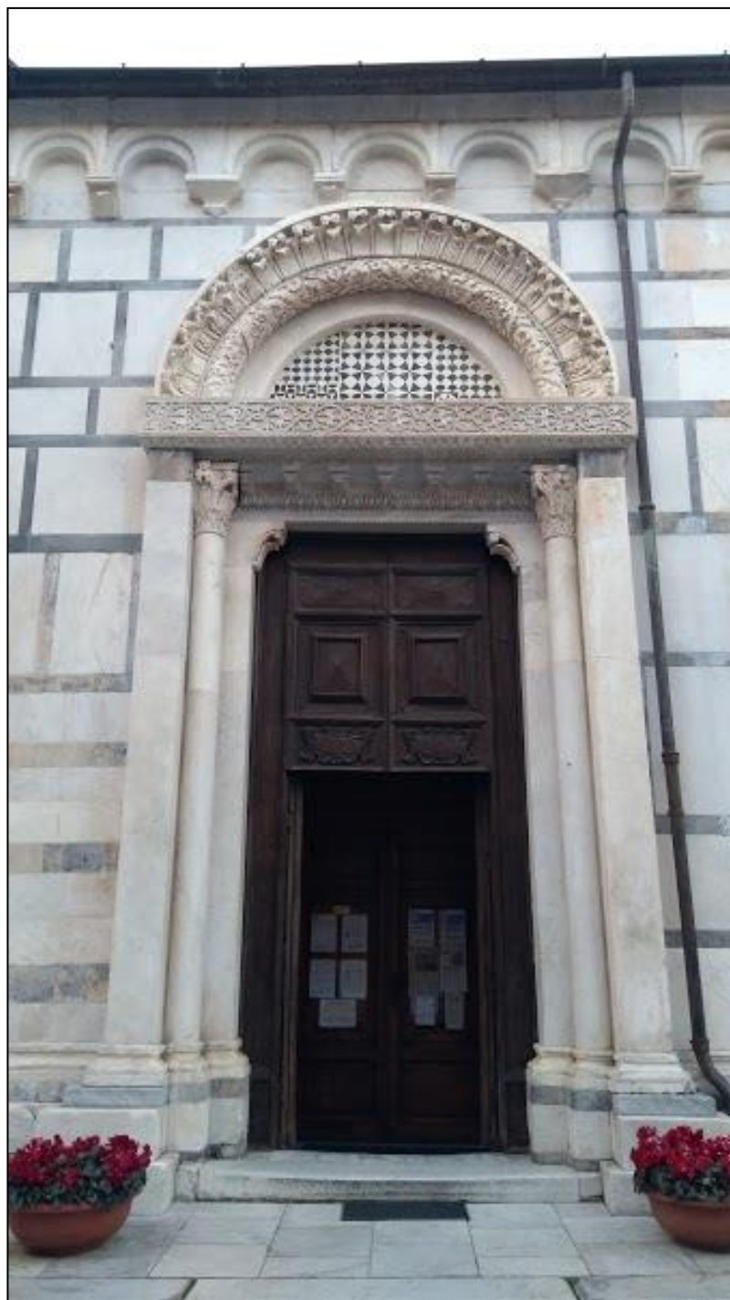
Fig. 8 - Carrara, Sant'Andrea, fianco sud, portale di S. Giovanni.