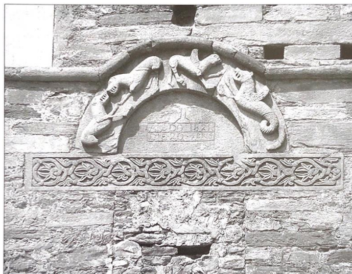
Fig. 6 - Piedicorte di Gaggio, Santa Maria, sculture reimpiegate nel campanile (da Coroneo 2006: 123).