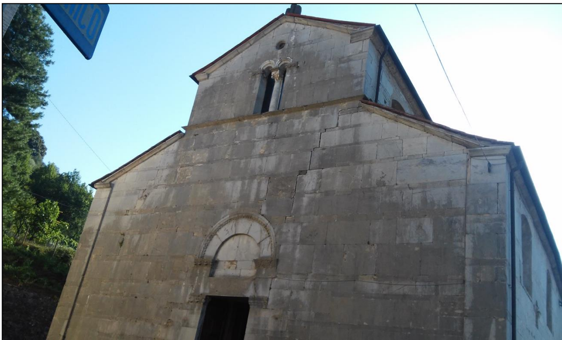
Fig. 3 - Borgo a Mozzano (Lucca), San Pietro a Valdottavo, facciata.