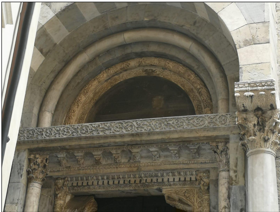
Fig. 10 - Genova, San Lorenzo, fianco nord, portale di S. Giovanni, dettaglio.

Nicoletta Usai, Santa Maria Assunta di Mariana (Lucciana, Haute-Corse) .