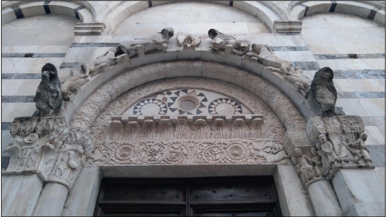
Fig. 7 - Carrara, Sant'Andrea, facciata, dettaglio del portale.