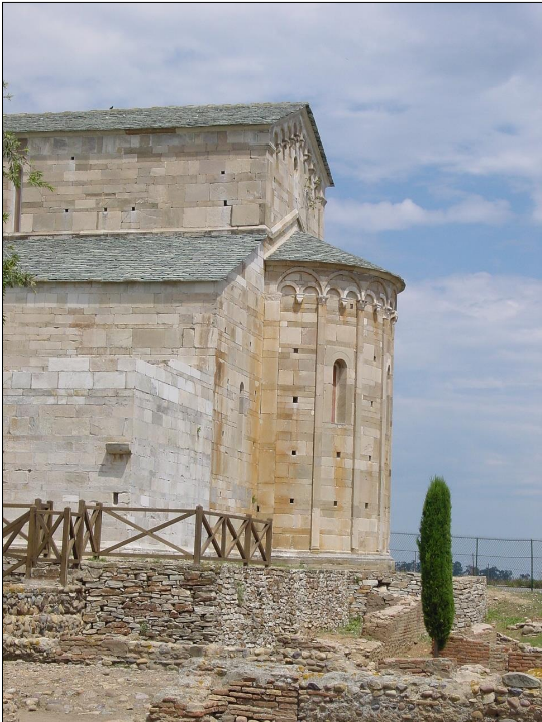
Fig. 4 - Mariana (Lucciana, Haute Corse ), Santa Maria Assunta, prospetto absidale.