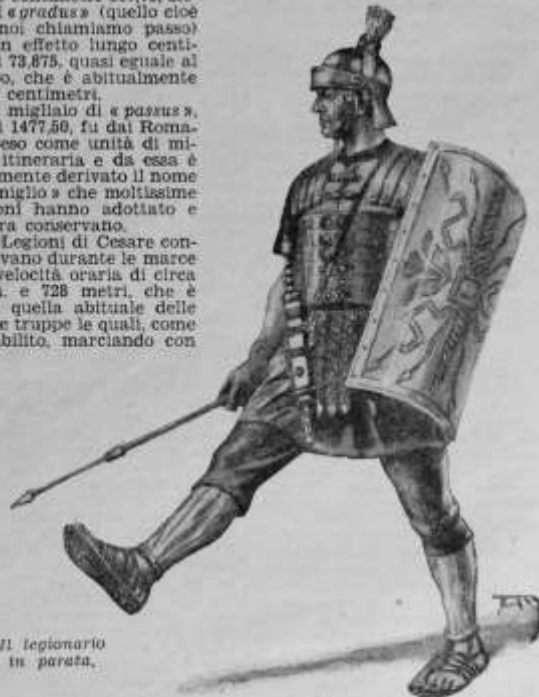
Il legionario in parata.