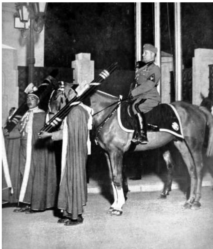
Fig. 5 – L'Illustrazione Italiana (a. 64, n. 11, 14 marzo 1937); Mussolini a cavallo preceduto da due littori (da Giuman, Parodo 2011: Fig. I.21).

Ma nonostante le pretese di veridicità storica, corroborate anche dagli studi di illustri archeologi quali Pericle Ducati (1880-1944) ( Origine e attribuiti del fascio littorio , Bologna 1927) e Antonio M. Colini (1900-1989) ( Il fascio littorio , Roma 1938) (Giardina 2000: 225; Torelli 2010: 397), il significato dei fasces durante il Ventennio si discostava notevolmente da quello che possedeva nel mondo romano. Simbolo dell' imperium magistratuale quale insegna del potere coercitivo esercitato tramite le pene della fustigazione o della decapitazione, i fasci erano portati dai lictors che avevano il compito di coadiuvare il magistrato nell'espletamento delle sue funzioni (Schäfer 1989: 196-202, 206-209; Tassi Scandone 2001: 122-127).