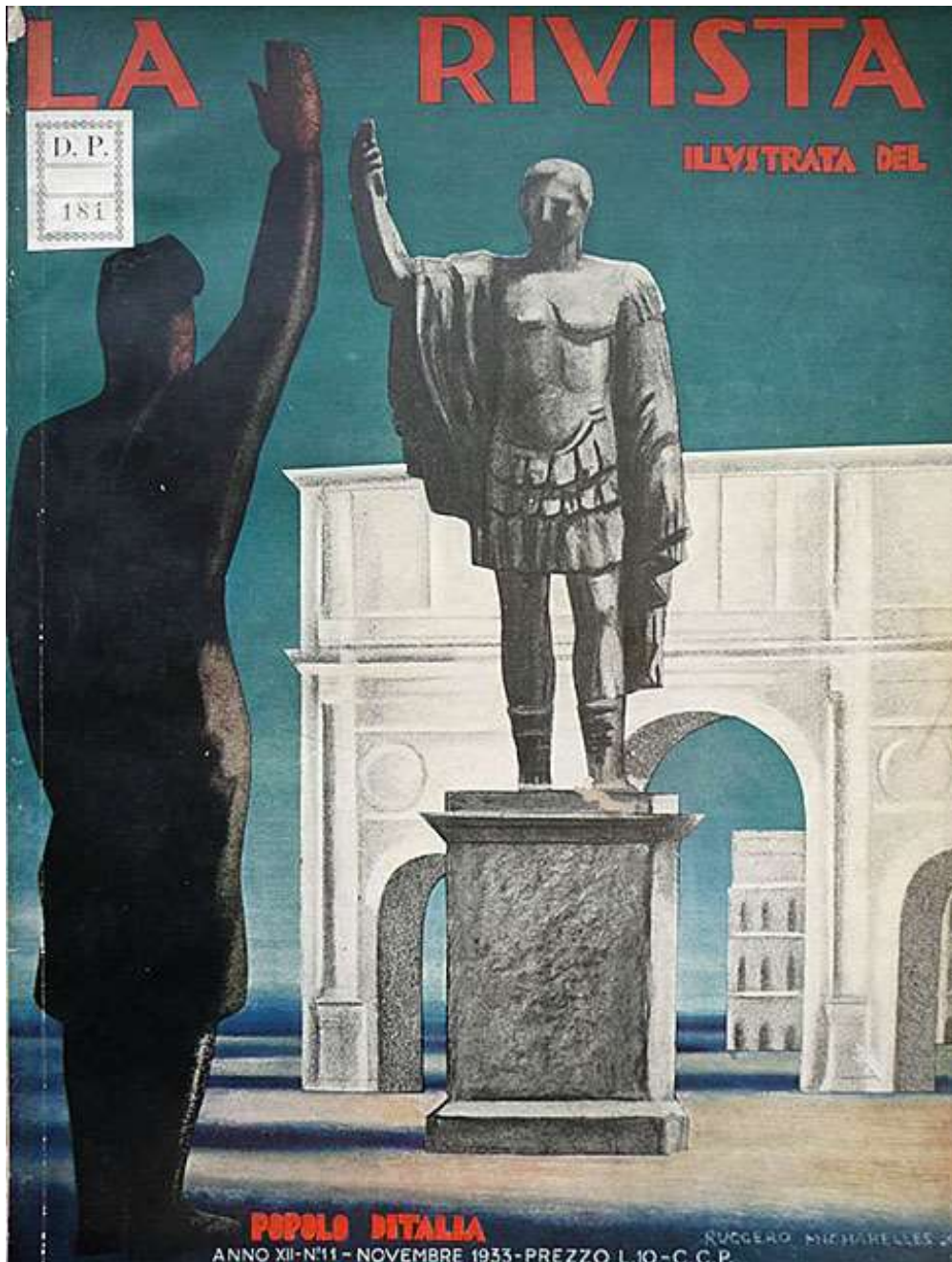
Fig. 3 – La Rivista Illustrata del Popolo d'Italia (a. 12, n. 11, Novembre 1933), copertina; il saluto romano (da Manfredi 2014: 39).