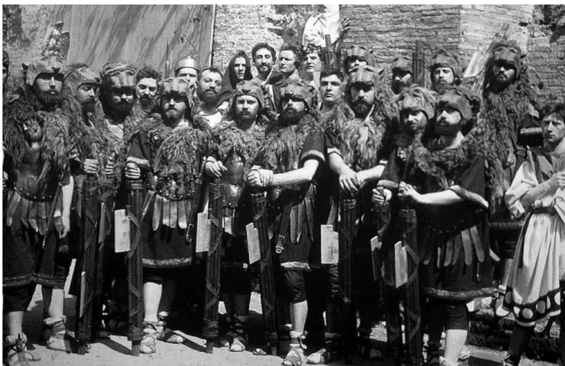
Fig. 8 – «La festa delle Palilie. Ricostruzione di Giacomo Boni»; foto-ricordo (1902) (da Fancelli 2008: fig. 4).

un'ossessione per l'archeologo, come conferma una lettera datata 7 Aprile 1923 in cui annotava: «A proposito della esplorazione del Lupercale, la culla della civiltà romana, non sarebbe male che un giorno S.E. il Presidente Mussolini, in maniche di camicia nera, desse il primo colpo di piccone o scavasse la prima palata di terra» (cit. in Salvatori 2012b: 278; cfr. Consolato 2006: 192).