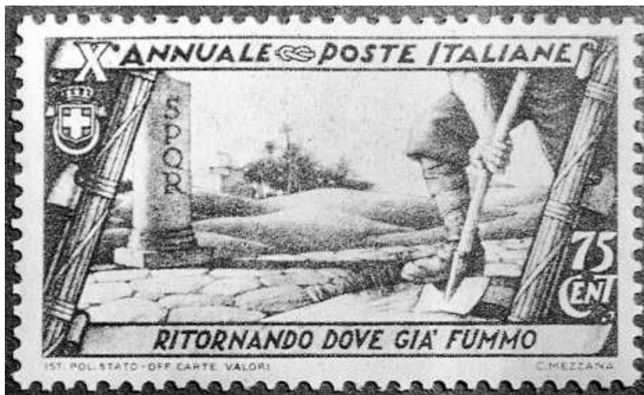
Fig. 1 – «Ritornando dove già fummo»; francobollo (1932) (da Giuman, Parodo 2011: Fig. I.6).

Proprio durante il Ventennio l'idea di Roma venne radicalmente sottoposta a meccanismi modernistici di sfruttamento del mito già ampiamente noti alla politica di massa e articolati intorno all'uso del linguaggio dell'estetica, della spettacolarizzazione teatrale e del discorso verbale (Falasca Zamponi 1992 e 1997; Gentile 1996; Scriba 2014), perché, come affermò Mussolini il 21 Aprile 1922, natalis Urbis , «Roma è il nostro punto di partenza e di riferimento; è il nostro simbolo o, se si vuole, il nostro mito» ( Opera omnia 1959, vol. XVIII: 161).