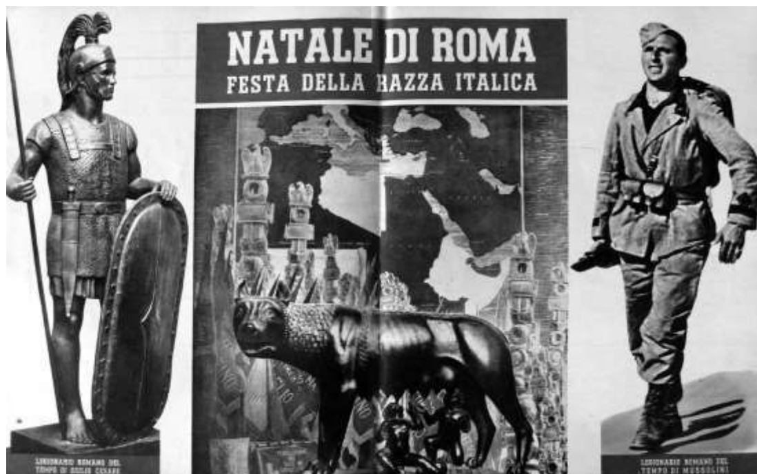
Fig. 6 – «Natale di Roma. Festa della razza italica»; La Difesa della Razza (a. 3, n. 12, 20 Aprile 1940) (da Giuman, Parodo 2011: Fig. I.3).

L'istituzione del Natale di Roma come festa fascista avvenne per la prima volta il 3 Aprile 1921, in occasione dell'inaugurazione del primo convegno dei Fasci dell'Emilia-Romagna, quando Mussolini suggerì l'assunzione del passo romano per celebrare degnamente tale evento, ma essa fu ufficialmente adottata dal regime solo il 19 Aprile del 1923 (Falasca Zamponi 1997: 91-92; Giardina 2000: 227-229). La celebrazione fascista del natalis Urbis divenne così l'occasione per commemorare una serie di eventi basilari per la mistica del regime (Giuman, Parodo 2011: 32-34).