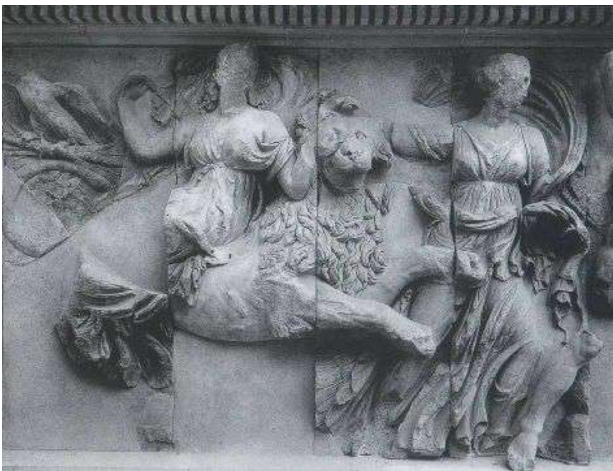
Fig. 7. Berlin, Pergamonmuseum. Grande Altare, lato meridionale della Gigantomachia: Cibele (da Massa-Pairault, 2007 Pl. XIX.b).