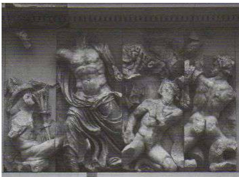
Fig. 3. Berlin, Pergamonmuseum. Grande Altare, lato orientale della Gigantomachia: Zeus, coadiuvato da Eracle, combatte contro Porfirione (da Massa-Pairault, 2007 Pl. LXIX.b).