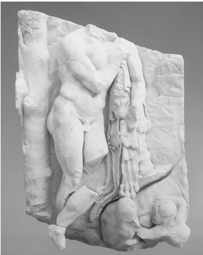
Fig. 11. Berlin, Pergamonmuseum. Grande Altare, lato settentrionale della Telefeia: Telefo allattato da una leonessa (da L'Altare di Pergamo , 1996 Cat. 5).