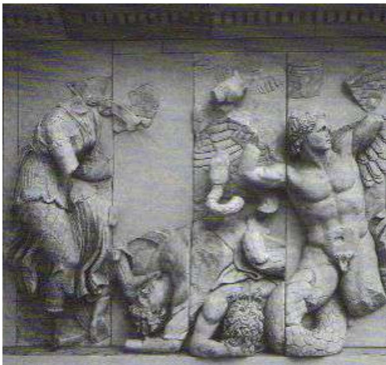
Fig. 5. Berlin, Pergamonmuseum. Grande Altare, lato settentrionale della Gigantomachia: Afrodite e Eros (da Massa-Pairault, 2007 Pl. XL.).