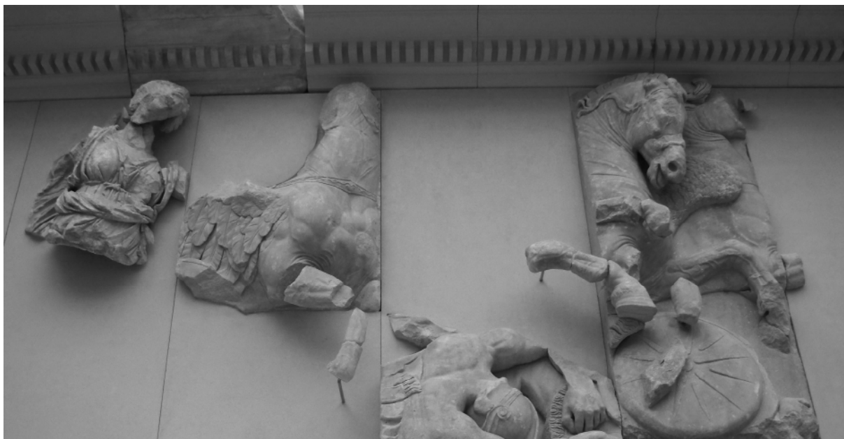
Fig. 6. Berlin, Pergamonmuseum. Grande Altare, lato orientale della Gigantomachia: Hera alla guida della quadriga dei Venti.