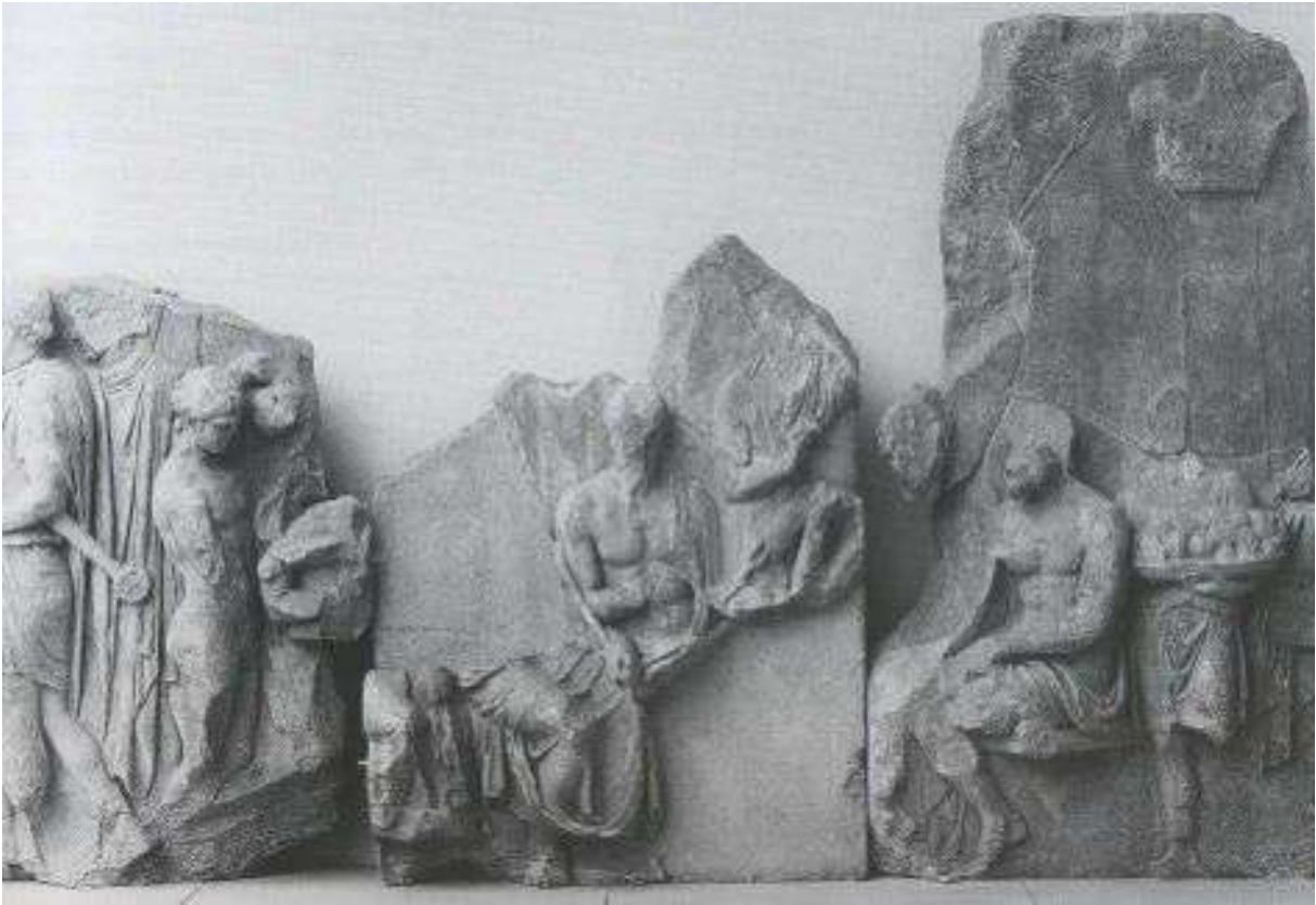
Fig. 10. Berlin, Pergamonmuseum. Grande Altare, lato meridionale della Telefeia: Telefo, seduto a destra, accolto dagli Achei ad Argo (da Queyrel, 2005b fig. 91).