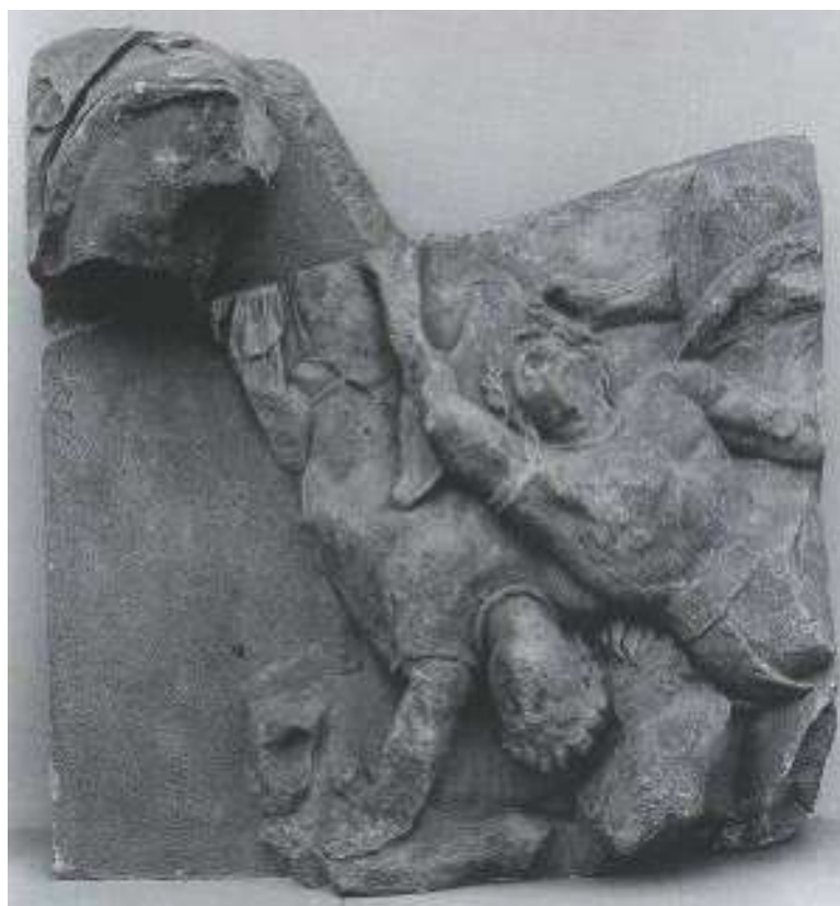
Fig. 9. Berlin, Pergamonmuseum. Grande Altare, lato orientale della Telefeia: morte di Eloro e Atteo (da Queyrel, 2005b fig. 88).