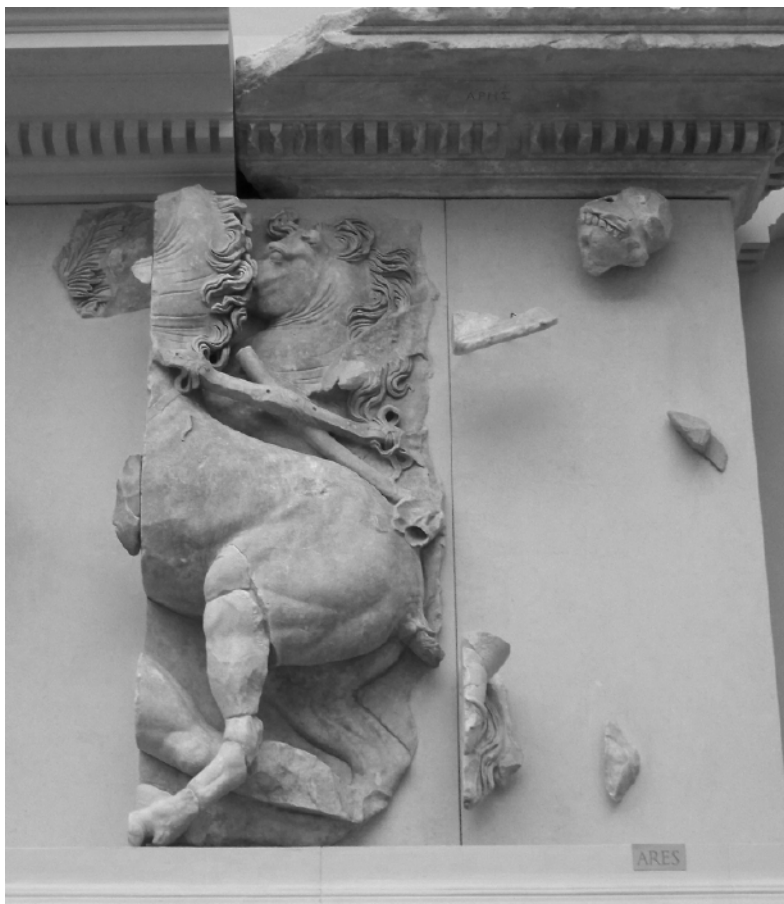
Fig. 4. Berlin, Pergamonmuseum. Grande Altare, lato orientale della Gigantomachia: Ares alla guida di una biga.