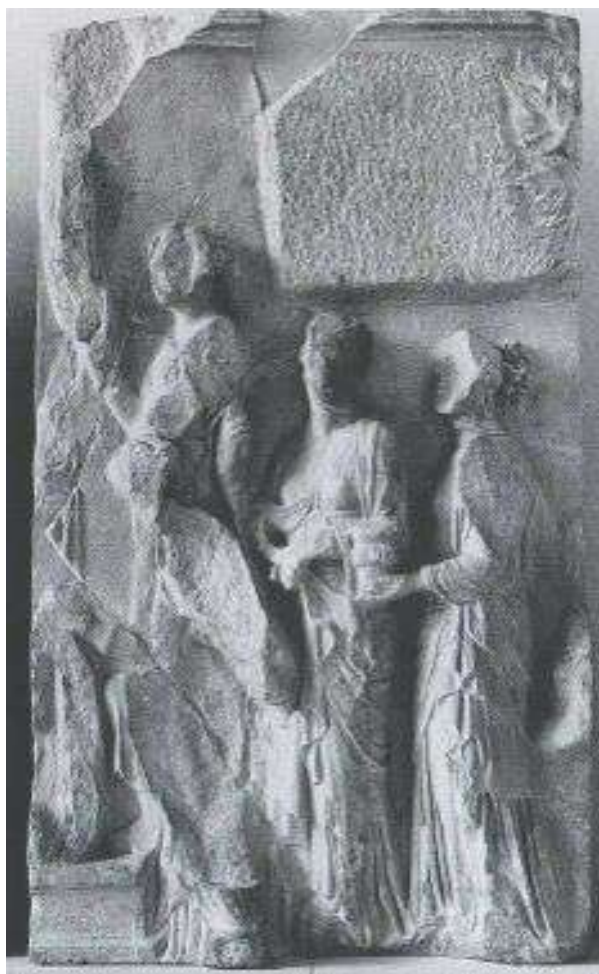
Fig. 2. Berlin, Pergamonmuseum. Grande Altare, lato settentrionale della Telefeia: Auge e le sue ancelle ornano il simulacro di Atena a Tegea (da Queyrel, 2005b fig. 77).