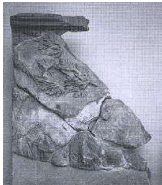
Fig. 12. Berlin, Pergamonmuseum. Grande Altare, lato settentrionale della Telefeia: profili di un uomo e una donna, presumibilmente la coppia di pastori a servizio del re Corito che allevrà Telefo (da Massa-Pairault, 1998 fig. 9).