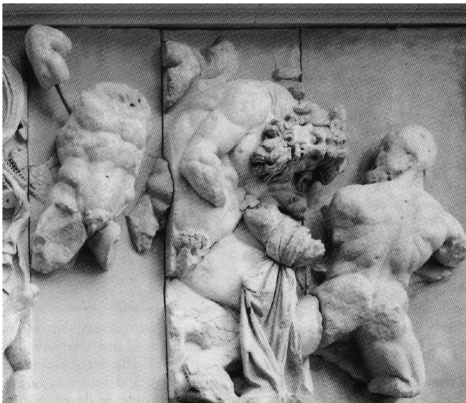
Fig. 8. Berlin, Pergamonmuseum. Grande Altare, lato meridionale della Gigantomachia: i Cabiri affrontano un gigante taumomorfo (da Moreno, 1994 fig. 578).