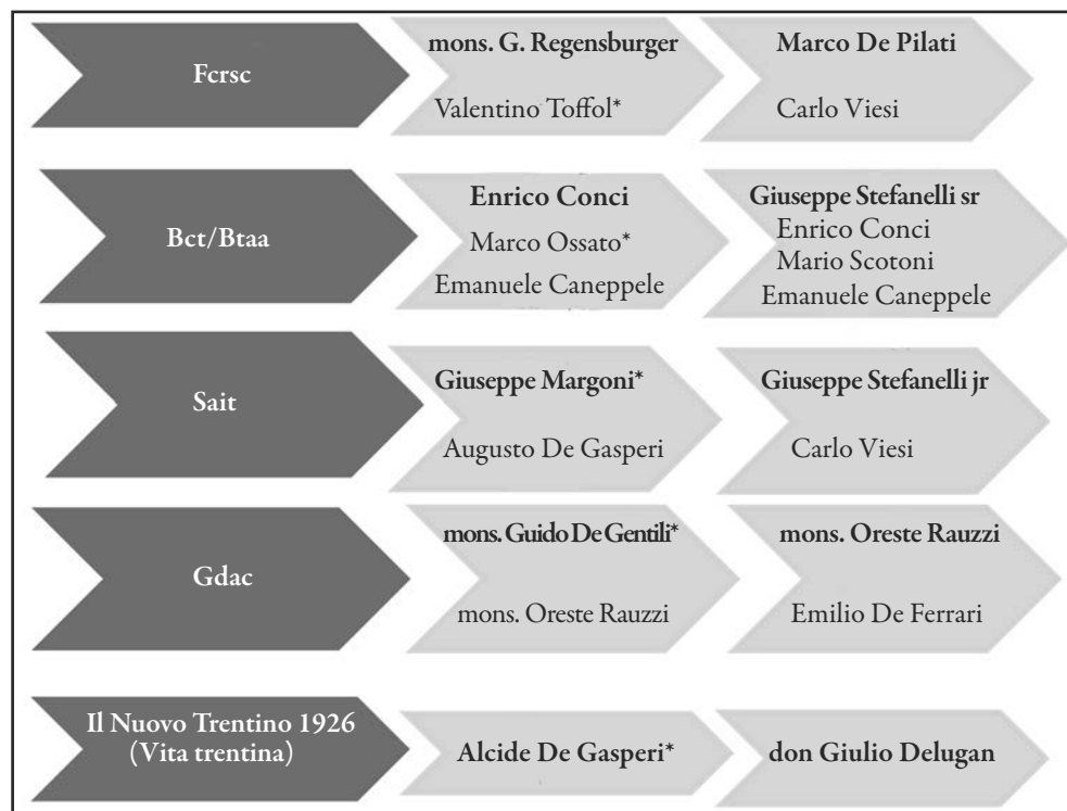
Tabella 3. I ricambi al vertice nel 1926-1927