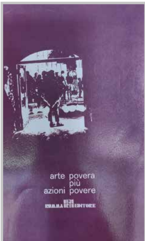
La copertina del catalogo di Arte povera più azioni povere , Salerno, Rumma, 1968

Va precisato anzitutto che la forma-convegno, negli anni Sessanta in Italia, non è ancora diffusa e consolidata nei termini di quello spazio di confronto e ibridazione fra le arti in cui si convertirà a partire dai Settanta, dischiudendo radicali orizzonti di ripensamento dei saperi e in special modo dei loro confini. Non che non si organizzassero già iniziative di questo genere nell'uno e nell'altro campo. 3 Ma, almeno per quanto concerne il teatro,