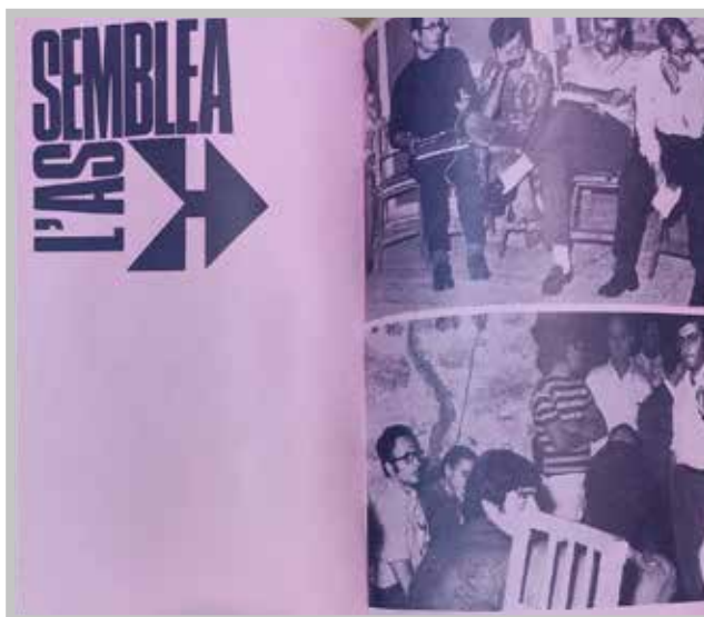
L' Assemblea di Amalfi, documentata nel catalogo di Arte povera più azioni povere

Nei testi correlabili al convegno marchigiano la rete di potenziali