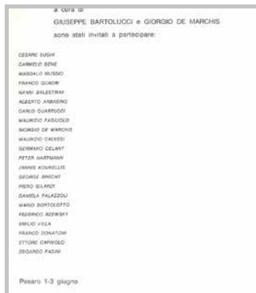
Il lancio del convegno Per un nuovo senso dello spettacolo su «Marcatrè», nn. 37-40, maggio 1968

Più che a rapporti effettivi fra arti e teatro, possiamo dire semmai che dal punto di vista teorico, in questo periodo, ci troviamo di fronte a un doppio movimento, comunque prezioso ma certo non condiviso, costituito da «due vettori opposti e complementari»: da un lato, la «teatralizzazione delle arti», e, dall'altro, un processo che potremmo definire all'insegna della 'visualizzazione' o 'spazializzazione' del teatro. 27 Si tratta di una doppia spinta che, più che provocare già convergenze concrete, si configura nei termini di una premessa: alla creazione di un campo di forze, in vista di un dialogo ancora del tutto potenziale, che proprio in questa fase si comincia a saggiare in maniera concertata dal punto di vista teorico-critico, con il carico di ricadute che segnerà i due ambiti e le reciproche relazioni nei decenni seguenti.