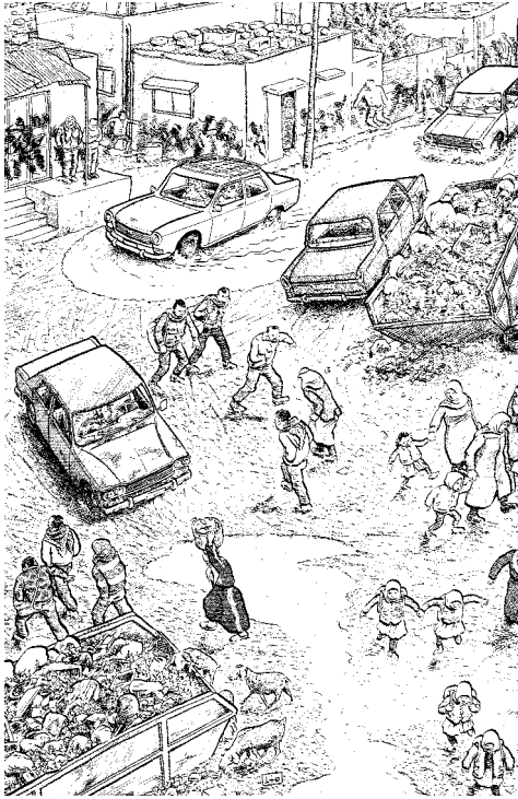
Figura 2. Particolare.

Nel suo Tra guerra e pace , così Said descrive l'arrivo a Gaza: "Si entra nella striscia di Gaza passando per quello che di fatto è un grande cancello, chiuso la notte, che conferisce al luogo l'aspetto di un enorme campo di concentramento", 15 probabilmente riferendosi allo stesso cancello raffigurato da Sacco a pagina 247, con la scritta non priva di un'ironia feroce e involontaria "Welcome to Gaza", in inglese ed ebraico (una eventuale versione in lingua araba non è visibile nella vignetta), che nella fattura richiama inevitabilmente l'ingresso dei campi di concentramento nazisti, con l'immane scritta "Arbeit macht frei". Accompagnato da una pioggia quasi incessante, durante la sua permanenza a Gaza Sacco percorre parallelamente strade e storie: gli attacchi israeliani del 1989 (p. 153), le sciagurate vicende dei coltivatori di pomodori, costretti a vendere i loro prodotti come israeliani, pena la assoluta impossibilità di esportarli (pp. 170-