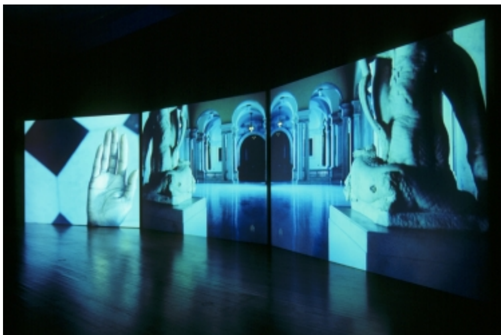
Baltimore: riscrivere lo spazio museale

d'arte attraverso le performance camp di Bianca Jagger. In particolare, c'è un esplicito riferimento a Cocteau quando lo stesso Vezzoli, con gli occhi disegnati sulle palpebre chiuse, si colloca a un lato di un letto, mentre Bianca Jagger sta dall'altra parte. Entrambi i lavori possono essere visti nella mostra "Experiments of Truth" al Fabric workshop del museo di Philadelphia, e non al cinema.