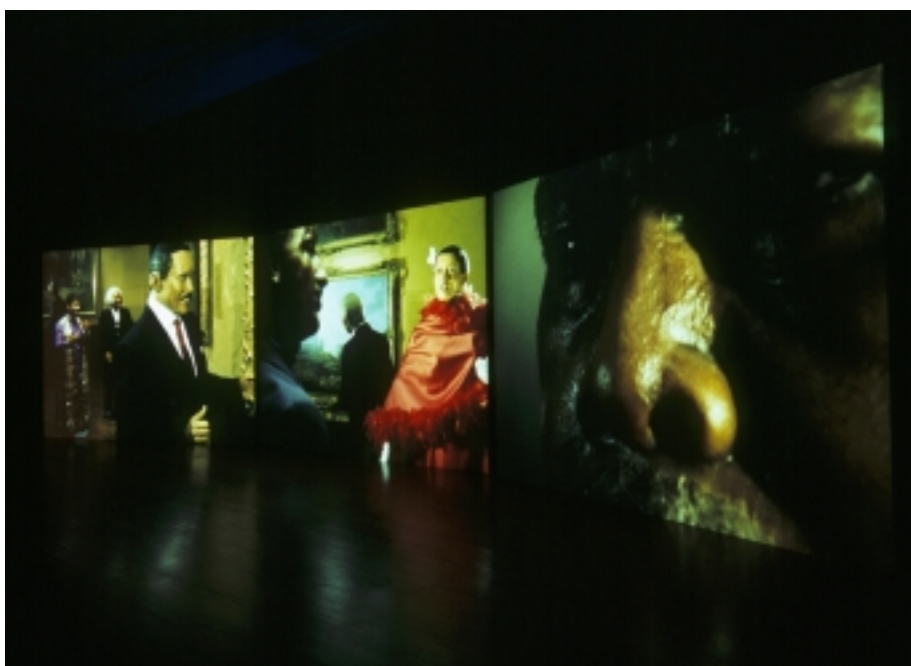
Baltimore: il museo delle cere

Baltimore è ambientato nella Walters Art Gallery, un importante museo rinascimentale che si trova nel centro di Baltimora, e nella sala Great Blacks presso il museo delle cere (una specie di Madame Tussauds riuscito male, o una installazione alla Thomas Hirsh in versione nera, e una delle dieci maggiori attrazioni storiche afroamericane di tutti gli Stati Uniti). Traspare chiaramente tutto il mio interesse per gli spazi d'archivio, e per i loro rapporti con i temi del potere, della memoria e della conservazione del passato.