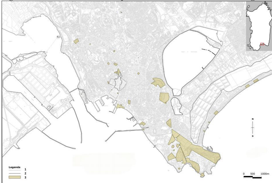
Fig. 1 – Beni in uso alle diverse Forze Armate nel territorio del comune di Cagliari

Legenda: 1 – Perimetro medievale; 2- Fortificazioni storiche (XV – XVII secolo); 3 – Demanio Militare